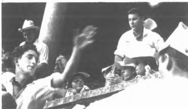
Fig. n.º 53.- Bebiendo en la plaza. Fiestas de San Fermín (Pamplona). Apud Masats, R. y García Serrano, R. (1963): Los Sanfermines , Madrid, Espasa Calpe.

Un aspecto de lo que ocurre en el ruedo: lo que más enfurece al espectador (me atrevería a decir que es lo único que le pone fuera de sí) es la blandura y la mansedumbre del toro. En