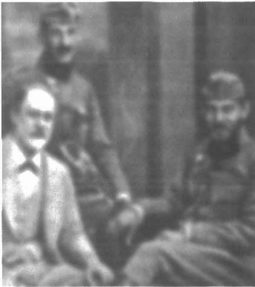
Fig. n.º 58.- Freud con sus hijos, soldados . Apud Freud (1973: I, Lám. 17).

se cura en salud afirmando que tal estado social primitivo no ha sido observado en parte alguna. Lo único observable es la sociedad totémica, es decir la humanidad ya constituida. Nada más razonable, pues observar la hipótesis previa equivaldría a observar la pura animalidad, la cual en la teoría freudiana es por definición inobservable e irrepresentable (Fig. n.º 58).