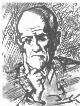
Fig. n.º 52.- Dal1: Freud retratado durante la 1nica breve entrevista que celebraron. Apud Freud (1973: I, L1m. 35).