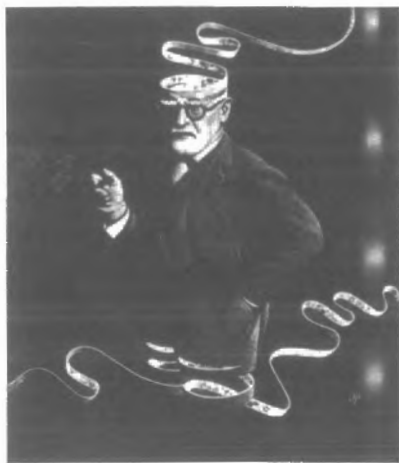
Fig. n.º 54.- Don Punchatz: Crisis del Psicoanálisis . Apud Freud (1973: III, Lám. 80).

hermanos en el acto fundacional de su fraternidad es la misma que, sin que ellos lo sepan, conmueve a los espectadores de los tendidos. De tal forma que la lectura atenta del texto de Freud nos ilustra sobre lo que de verdad estamos contemplando en una corrida de toros. El texto de Freud funda en razón lo que cualquier aficionado intuye obscuramente, a saber, que en ningún otro terreno se está haciendo patente de forma tan radical lo que constituye la relación fundamental u originaria, la esencia de