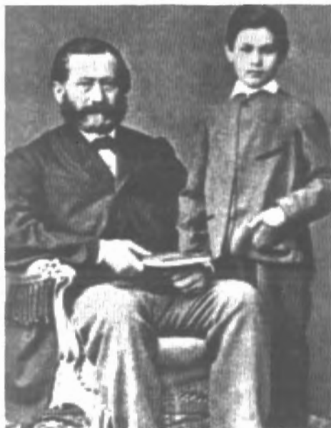
Fig. n.º 57.- Freud de niño, con su padre con quien siempre estuvo enfrentado Apud Freud (1973: I, Lám. 8).