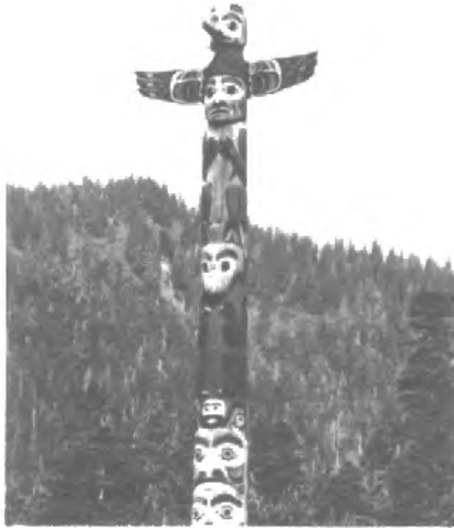
Fig. n.º 55.- Tótem. Apud Freud (1973: 2, Lám. 71).

«¿Qué es un tótem? –se pregunta el célebre psicoanalista–. Por lo general un animal comestible, ora inofensivo, ora peligroso y temido –más raramente una planta o una fuerza natural (lluvia, agua)–