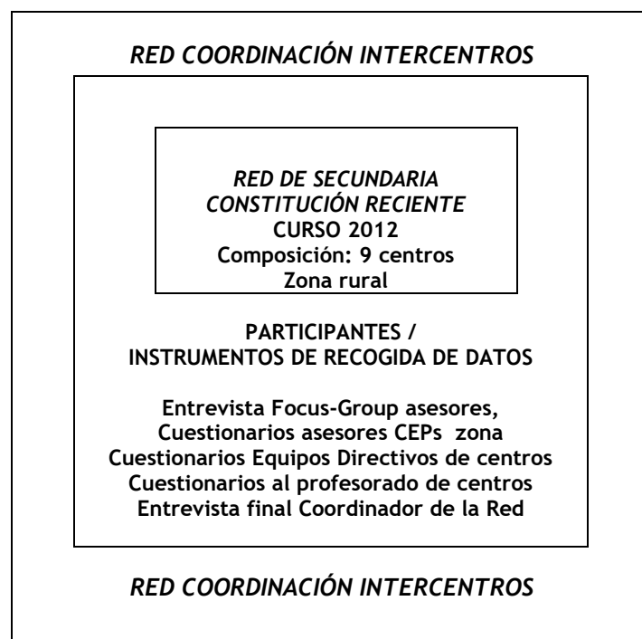
Figura 1. Datos de la Red de Coordinación Intercentros.

En la figura 1 se presenta un esquema de los participantes e instrumentos de recogida de datos de la “Red de Coordinación Intercentros”: