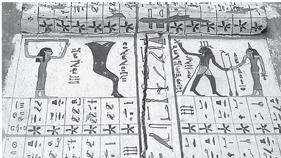
Figura 2. Panel central de un reloj estelar, ataúd SITü de Idi (Siut, Reino Medio).

y participando como ritualista en las liturgias de custodia y reconstitución del cuerpo e identidad del difunto.