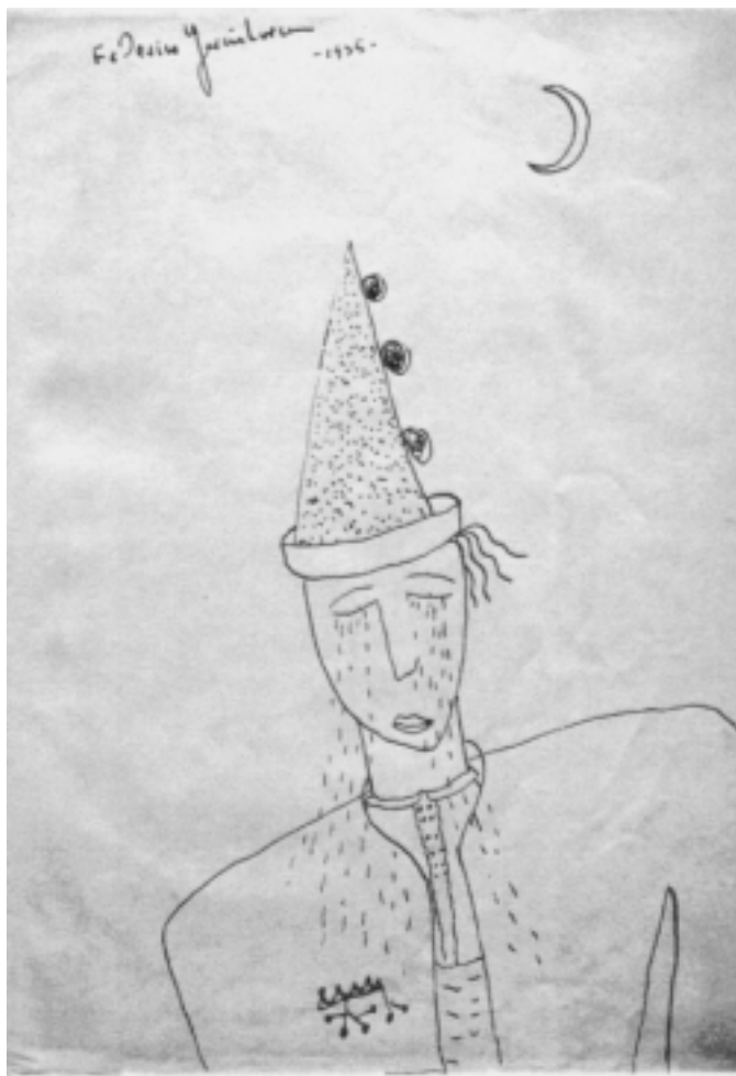
Fig. n.º 17.- Dibujo de Federico García Lorca que acompaña al manuscrito del Llanto (Archivo de la Casa de Tudela).