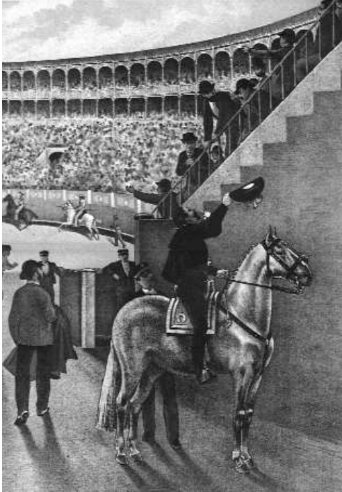
Fig. n.º 19.— El alguacilillo se dispone a recibir del Presidente la llave de toriles (Apud. postal).

hecho: «entre todas las funciones, la de toros es la que más brillo y realce da a la clase, y mejor revela la importancia de