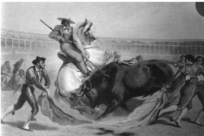
Fig. n.º 20.— Ginain: Suerte de varas de la serie La Course des taureaux , Paris, Goupil, h. 1855 (Apud. Col. particular).

parejas, los celos hacen tregua, las conversaciones se suspenden y veinticuatro mil ojos, rebajando los de algunos espectadores tuertos, salen al encuentro de la fiera. Ábrese por fin el toril, y entra el bicho en la arena» (Flores, 1877: 243).