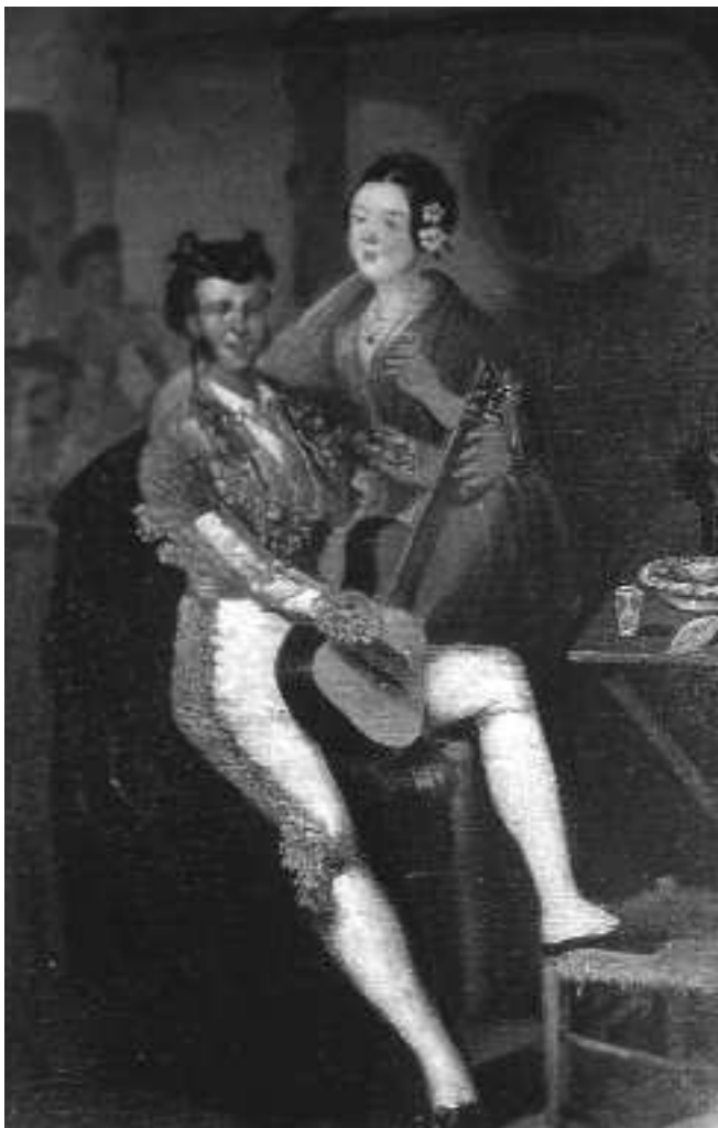
Fig. n.º 18.— Rodríguez Guzmán: Maja y torero , ól./l., 41 x 62 cms. (Apud. Catálogo del Museo de la Plaza de Toros de la Real Maestranza de Caballería de Sevilla).