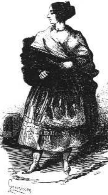
Fig. n.º 17.— La maja , grabado de Giménez (Apud. AA.VV., 1851: 210).

para afean costumbre tan bárbara. Aunque siempre salen defensores de los toros que arremeten contra lo que ellos consideran una actitud hipócrita. Antonio Flores, por ejemplo, no