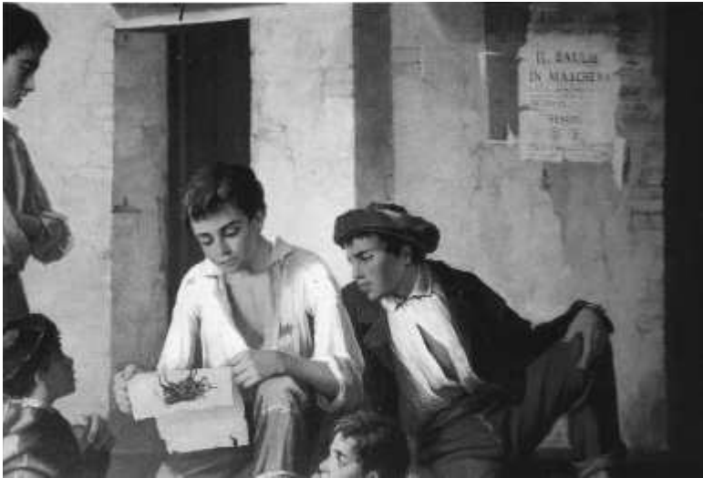
Fig. n.º 22.– Roldán: Niños leyendo un cartel de toros mientras que en la pared se anuncia la ópera Il Ballo in Maschera , ól./l., Museo de Figueras (Apud. Quesada, 1992: il. 129).

as, el dinero que quizá no era suyo. En un texto de Antonia Díaz de Lamarque (¿1881?), aparecía una interesante información. Esta escritora quería restituir la imagen de la mujer sevillana en cuanto a su afición a los toros y justificar que su presencia en la plaza se reducía, por regla general, a las corri-