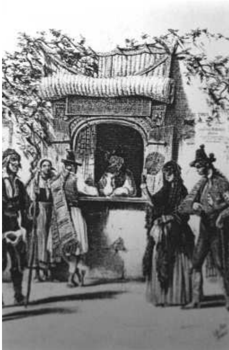
Fig. n.º 15.— Lake-Price: Venta de localidades , litografía coloreada (Apud. 1852: lám. I).

de billetes, a «un centenar de personas que seguramente maldicen de los toros toda la semana, menos el lunes por la tarde» (Azcona, 1839: 1010b). La compra directa de los boletos era el método más usual, pero, como hoy, también funcionaba la