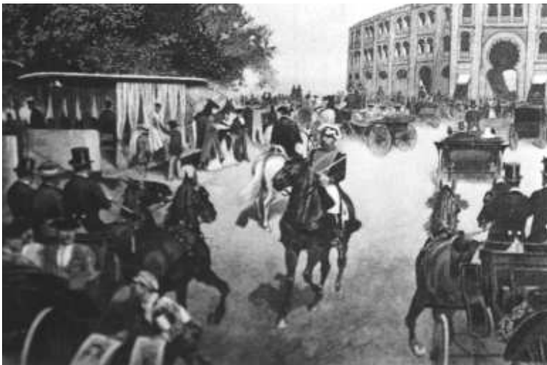
Fig. n.º 13.— Perea: A los toros , acuarela en —: Álbum , Barcelona, litografía y encuadernación de H. Miralles, Barcelona, h. 1896 (Apud. Berckemeyer, 1966: lám. 157).

se reflejan a la perfección en un artículo que Mesonero Romanos incluyó en la segunda serie de sus Escenas matritenses . Me refiero a “El día de toros” (1836). Su primera parte: “La casa de vecindad”, reproduce esa notable anima-