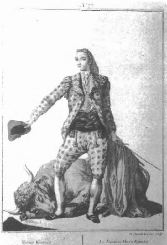
Fig. n.º 24.— Cano, Juan de la Cruz: Pedro Romero , grabado iluminado, Madrid, Museo Municipal.

dante, pronto empezaron los problemas. El más grave de todos fue el económico. Las ciudades que organizaban corridas no estuvieron en absoluto de acuerdo con las nuevas tasas para el sostenimiento del instituto sevillano por lo que, salvo escasísimas excepciones, recurrieron a la decisión real y se negaron a pagar. Esto provocó que Arjona, el intendente de Sevilla, que era también juez protector de la Escuela, se viese obligado a afrontar los gastos con fondos procedentes en exclusiva de la ciudad de Sevilla pero, aun así, la cantidad era insuficiente para el funcionamiento de la institución. Junto a esto, en los primeros momentos de euforia se había decidido construir una plaza para la Escuela argumentando que la que había en el matadero no era adecuada, con lo cual se