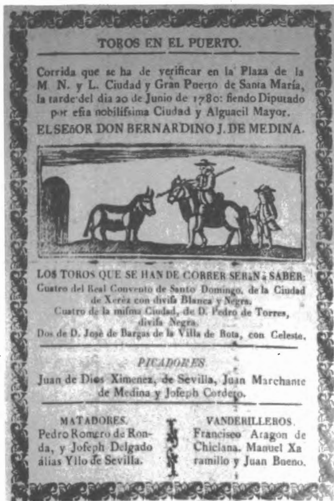
Fig. n.º 23.— Cartel de toros. Función de toros en el Puerto de Santa María anunciando a los matadores Pedro Romero de Ronda y José Delgado de Sevilla, 1780 (Apud.: Zaldívar, 1990: 116).