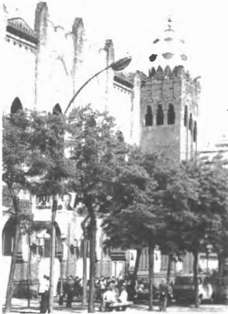
Fig. n.º 50.— Plaza de Toros Monumental de Barcelona (Apud.: González, 1996: 203).

Osonó, como si se tratara de un episodio de un pasado que era preciso olvidar» (pág. 18).