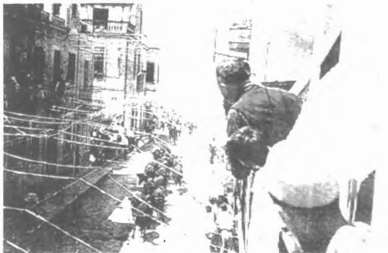
Fig. n.º 49.— Encierro de Toros en el Grao d'Amposta , fot. de J. J. Arbó (Apud.: González, 1996: 162).

protección de los animales que, a la postre, no tan sólo ha servido para limitar las corridas y demás fiestas populares con toros, sino que ha sido utilizada también como un perspicaz dispositivo de estigmatización de los taurófilos catalanes.