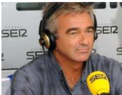
Imagen 4. Presentador en el estudio de la SER.

Nacido en Barcelona en 1958, Carles Francino es un presentador de radio que actualmente presenta el programa "La Ventana" de la Cadena SER. Empieza los estudios de Periodismo en la Universidad Autónoma de Barcelona, pero no llega a terminarlos porque comienza su carrera profesional en Radio Tarragona y a partir de entonces, se dedica a trabajar. En el año 1978, es fichado como redactor de deportes en la Radio Popular de Reus, para después incorporarse a la delegación de Tarragona de la Cadena COPE. Su andanza en la emisora del Grupo PRISA se remonta al año 1987, cuando se repartía el tiempo entre el periodismo y el fútbol, puesto que formó parte de varios equipos, llegando a jugar en el CF Reus Deportiu en la tercera división de la Liga.