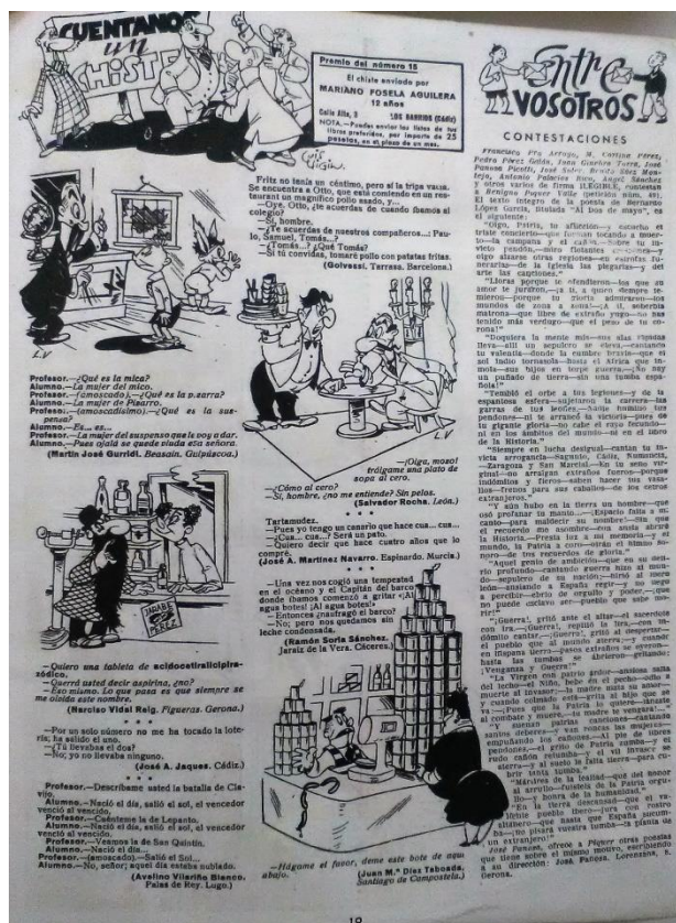
Figura 2. Sección “Entre vosotras”, ¡Zas!, Año I, nº 16, 28 de octubre de 1945, p. 19

Junto al “Año” se localizan otros datos como el número, y la siguiente aclaración: “Publicación quincenal en domingos alternos con censura eclesiástica”.