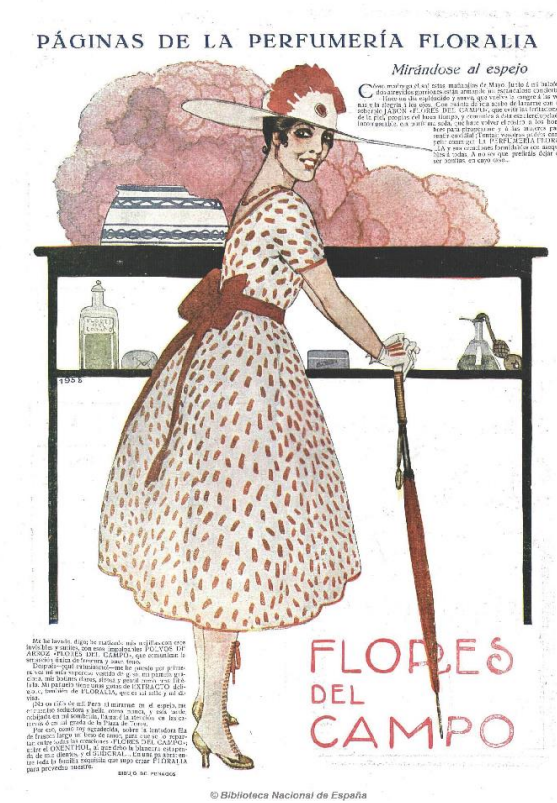
Figura 3: La Esfera, 16/06/1917

Finalmente, subrayar el carácter comercial de los dibujos, los productos de Floralia: jabones, colonias, polvos, etc., con presencia en el escenario del dibujo, en dos ocasiones llevan el nombre de la marca en los envases (figura 3), todo un guiño a la empresa para la que trabajaba.