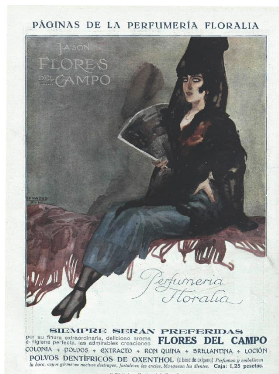
Figura 2: La Esfera , 25/05/1918

Además de los anteriores existen otro tipo de dibujos, sin escenario aparente, que evocan a la mujer española, hermosa, con clase, que despierta admiración por donde pasa; para representar este modelo femenino recurre al traje regional y a la mantilla en una exaltación del regionalismo hispano tan en boga en los artistas de la época. En este grupo se encuadran tres ilustraciones sobre fondo blanco, gris o negro que, por la postura de la protagonista, se asemejan a un retrato (figura 2).