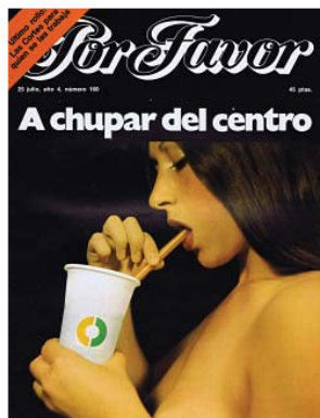
Fig. 5.2. 25/07/1977