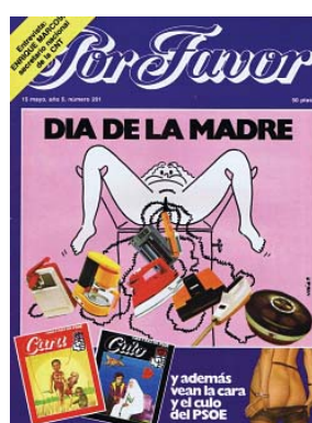
Fig. 6.2. 15/05/1978