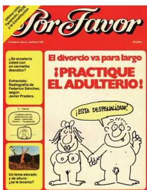
Fig. 6.1. 16/01/1978

reproductora como el mantenimiento del hogar. En la portada del número 201, Núria Pompeia 22 realiza una viñeta completada con un fotomontaje aprovechando la celebración del día de la madre (fig. 6.2.). A partir del sexo de una mujer desnuda, salen unos cables que conectan aparatos electrónicos, utilizados en el ámbito doméstico. El titular indica: “Día de la madre”. De este modo, la elaboración del humor se realiza mediante una sustitución/cosificación porque la mujer se convierte en una fuente de corriente eléctrica con la que hacer funcionar los aparatos que ella utiliza en las tareas del hogar. Asimismo, la correlación texto-imagen deja clara una intención desfavorable basada en el resentimiento ante la asignación de la función reproductiva como la principal en las mujeres y debido a la permanencia de un modelo familiar en que la figura femenina era la que tenía que llevar el hogar hacia delante.