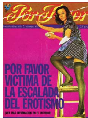
Fig. 3.2. 08/09/1975