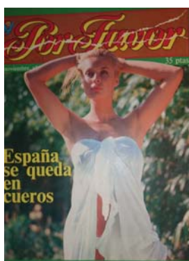
Fig. 1.1. 24/11/1975

o “Las ventajas de la ruptura” 15 (fig. 1.3.), haciendo referencia a la decisión del Parlamento Europeo que había dado el visto bueno a la disolución del pacto de apoyo entre los partidos de la oposición y el gobierno, después de que el equipo de Arias Navarro presentara un programa reformista que no terminaba de gustar en Europa ni en España. En todas estas muestras, la intencionalidad de los autores fue desfavorable y refleja una actitud de resentimiento frente a la forma de actuar del gobierno. Asimismo, el papel que encarna la mujer en todas estas portadas es de actor recayente, ya que no dirige la acción principal. La forma de representar la figura femenina, ligeras de ropa o semidesnudas y con una actitud sugerente, recalca que la importancia recae en la mostración del cuerpo para llegar a apelar la atención del receptor en el mayor grado posible.