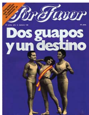
Fig. 5.1. 27/06/1977

traseros de mujer que acompañan al texto: “Nos han dado por el centro... Pero no está mal”. Por tanto, se vuelve a aprovechar la elaboración visual mediante los traseros así como la parte textual readecuando el dicho popular “dar por culo”. La elaboración del humor será, pues, el juego de palabras. Claramente, la intención del autor en este caso es favorable y se basa en principios de reforma. Igual que en el número 151, el papel de la mujer es de actor recayente, dado que su trasero sirve para ilustrar el titular.