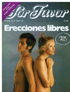
Fig. 4.1. 23/03/1977

el juego de palabras, pues en vez de optar por el titular informativo “elecciones libres”, traslada de nuevo un acontecimiento político a la esfera sexual (“erecciones libres”), mediante dos palabras que únicamente se diferencian en una letra.