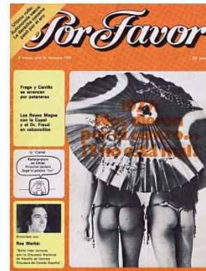
Fig. 5.3. 04/01/1978

El nuevo gobierno poseía una ardua tarea de cara a avanzar en derechos de las mujeres. El equipo de Por Favor era consciente de ello y así lo reflejó en sus portadas, obviamente mediante la figura de la mujer. En el número 185, publicado el 16 de enero de 1978, la primera página criticó los escasos avances en materia de divorcio y la vigencia de normas recogidas en el Código Penal que desprotegían a la mujer en caso de adulterio, mientras que el hombre lo tenía totalmente permitido 21 . La viñeta estaba protagonizada por un hombre y una mujer totalmente desnudos. En la parte textual se proclama: “El divorcio va para largo. ¡Practique el adulterio!” La idea se refuerza a través de una apreciación que hace la figura masculina, a modo de monólogo: “¡Está despenalizado!” (fig. 6.1.) Consecuentemente, la pieza gráfica se construye en torno a una posición desfavorable del hecho, desde la perspectiva de una reforma. Igualmente, la base satírica reside en la burla. Simplemente hay que prestar atención a la actitud del hombre a la hora de indicar su visión, y la respuesta totalmente pasiva de la mujer.