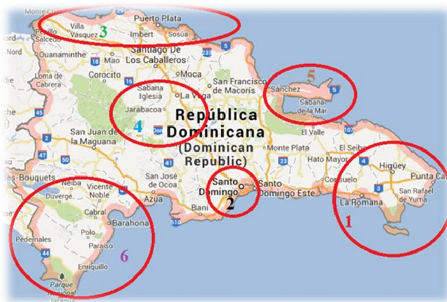
Figura 1. Mapa polos turísticos de República Dominicana

Según AGOSÍN et al. (2009), existen seis polos turísticos en República Dominicana (figura 1), si bien, el más importante es el localizado en la región este (figura 1, número 1), compuesto entre otros destinos por Bávaro y Punta Cana. En esta región dominicana, se ubican los principales destinos turísticos del país, consolidados en turismo de sol y playa, con una variedad de oferta de hoteles- resort . En esta zona geográfica también se localiza el área protegida más visitada, Isla Saona, perteneciente al Parque Nacional del Este, la cual, se beneficia de las excursiones de los turistas alojados en los hoteles- resort . Además, muy cerca a estos destinos también se localizan otros que pertenecen al mismo polo turístico (La Romana – Bayahibe), pero que reciben menos turistas que los dos destinos anteriores, que son como ya hemos mencionado, los más importantes en turismo de República Dominicana.