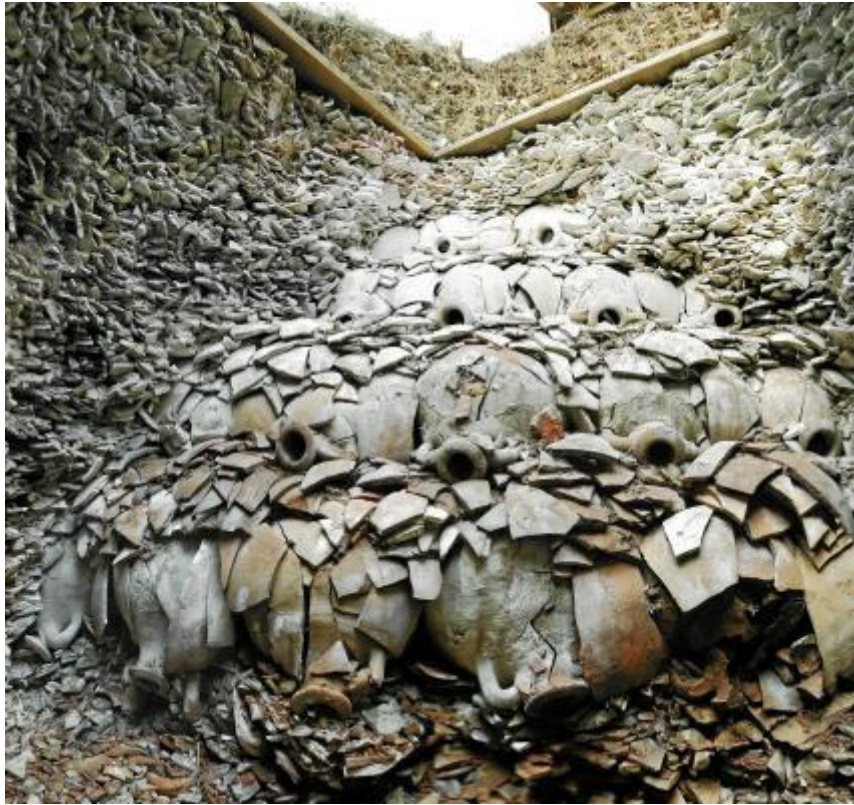
Foto 2. Ánforas que forman el Testaccio