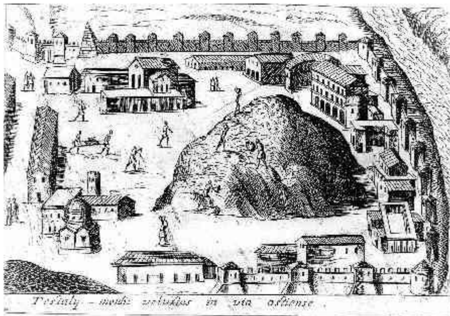
Foto 1. El Testaccio

Las excavaciones arqueológicas han sacado a la luz los 22000 metros cuadrados de ánforas rotas descubiertas en el famoso monte de los tiestos, o mejor dicho el Testaccio (foto 1).