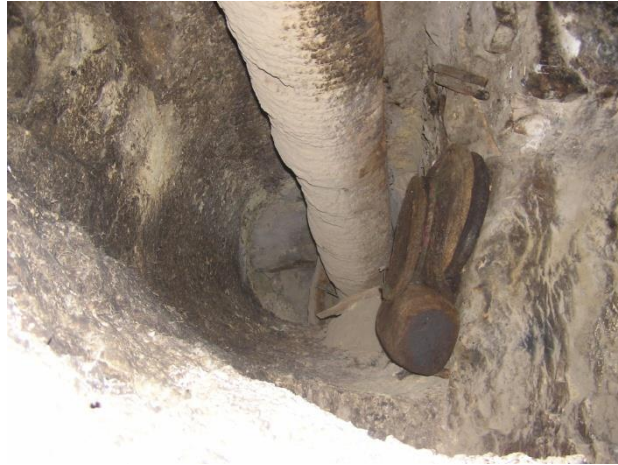
Foto 11. Sistema de peso