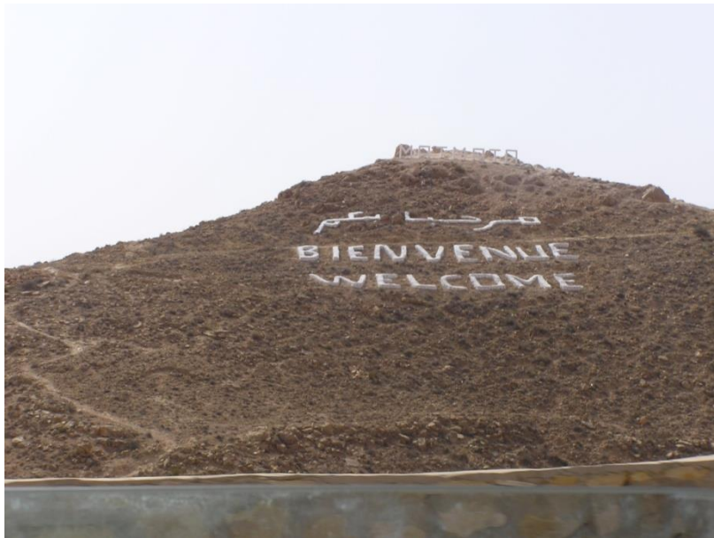
Foto 3. Paisaje del Camino hacia Matmata

Los beréberes tenían como capital Matmata. Vivían en el pueblo desde hace mucho tiempo. Han sido conquistados por muchas poblaciones: los Osmans, los Bárbaros, los Fenicios y los Franceses. Vivían en las barracas (casas) construidas por sus enemigos. Cuando vinieron los turcos y les obligaron a pagar excesivos impuestos, dejaron la ciudad y empezaron a vivir en las cavernas. Los beréberes que representan el 1% de la población tunecina, supieron conservar sus propias tradiciones, lengua y cultura.