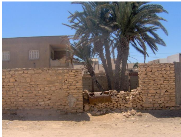
Foto 14. Vista desde el exterior del molino de Aïchoucha