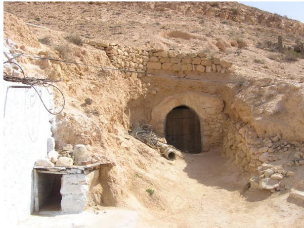
Foto 6. Entrada al molino subterráneo