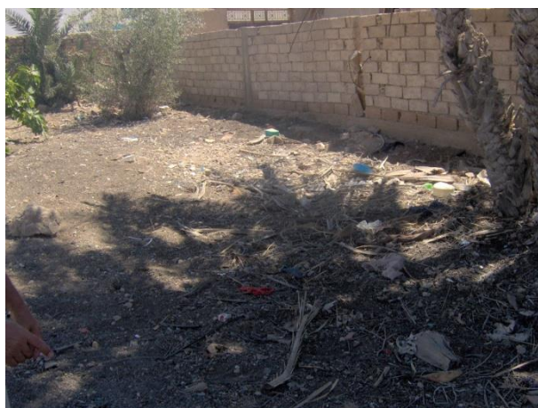
Foto 17. Emplazamiento de la cuenca de extracción de aceite de oliva