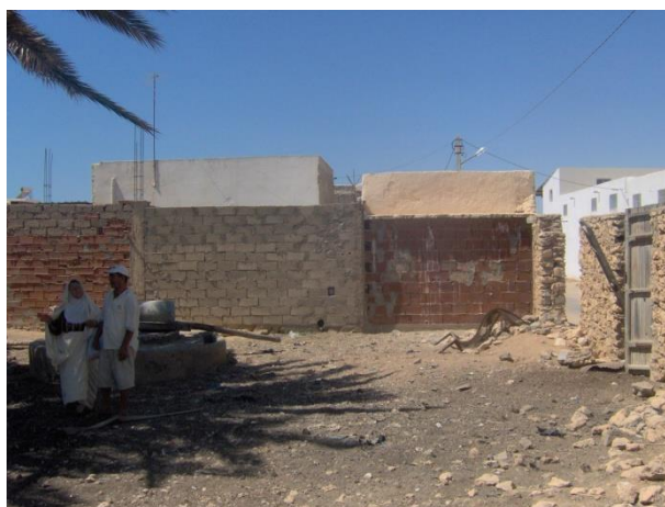
Foto 16. Emplazamiento del cuarto de extracción de la flor del aceite

A continuación, la pasta empobrecida de flor del aceite se traslada a una cuenca o un baño que se encuentra fuera, cerca de la piedra de molturación. Allí, se añade agua para recoger manualmente el aceite de oliva que flota. Luego, la pasta que teóricamente no contiene aceite pero realmente sí, se seca y se coloca en una cuenca justo al lado. Se trata del orujo como residuo de este proceso de extracción de aceite de oliva.