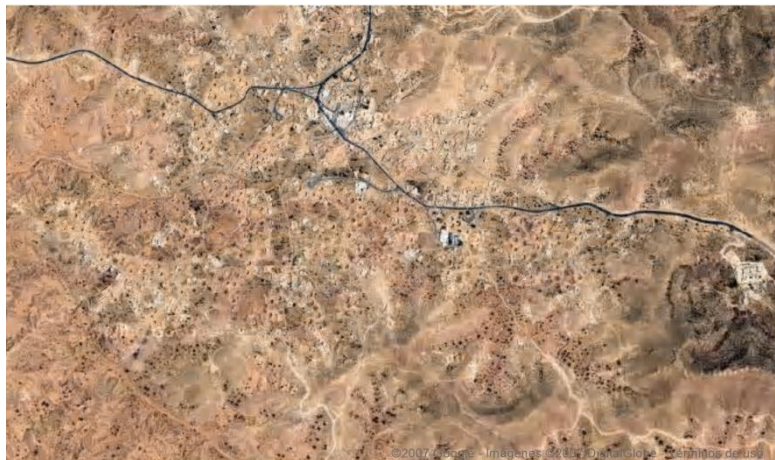
Foto 4. Foto satélite de Matmata

Antaño, estas casas trogloditas (cavernas) servían para ocultarse del enemigo. En efecto, viendo desde una colina, se puede fijar en una fosa "séptica" de ocho a diez metros de profundidad: se trata del patio central, con un diámetro de unos diez metros, desde el cual hay un pasillo que lo comunica con la base de la colina. Allí, la entrada al patio central podría estar cerrada por una puerta hecha con ramas de palmera. Estas casas trogloditas representan una mera adaptación a las campañas de saqueos ejercidas por los enemigos y conquistadores.