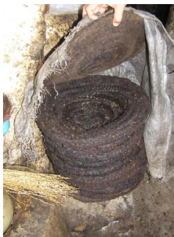
Foto 9. Capachos