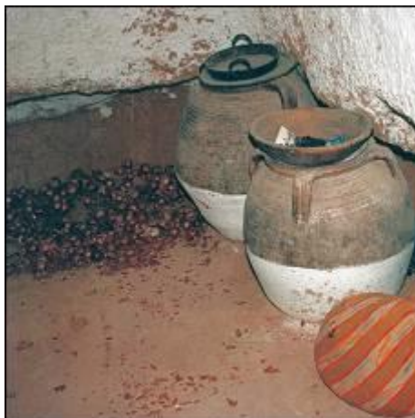
Foto 13. Almacenamiento de olivas y aceite de oliva