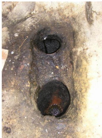
Foto 12. Pozos de decantación

Hay que notar que en semejantes espacios subterráneos, algunos propietarios de molinos tradicionales almacenan aceitunas para un largo período que puede alcanzar 10 años, según precisó el guía.