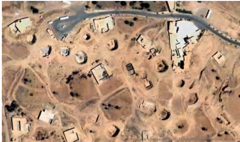
Foto 5. Foto satélite de las casas trogloditas

Uno de los elementos del patrimonio cultural de Matmata, consiste en un molino troglodita de aceite de oliva. Si nos fijamos en la siguiente foto, seguramente no nos esperamos estar frente a un molino troglodita.