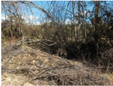
FOTO 12: Nota pie de imagen: Destrucción provocada por un incendio en la población de vid silvestre de Loja (Granada).

En la actualidad, las plagas, enfermedades y heladas tardías no son problema para la continuidad de este taxón. En cambio, el impacto antrópico se ha convertido en la mayor amenaza para su supervivencia. Así, las obras públicas (embalses, puentes, trazado de carreteras), la expansión de las zonas agrícolas, incluso, las urbanizadas, junto con diversas intervenciones en bosques de ribera, en algunas zonas coluviales y deltas de algunos ríos son algunas de las causas que han llevado a la vid silvestre a figurar como especie amenazada en la lista roja publicada por la Unión Internacional para la Conservación de la Naturaleza (IUCN, 1997).