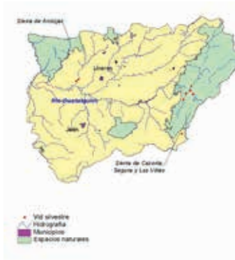
FOTO 8: Nota pie de imagen: Localización de las poblaciones de vid silvestre de la provincia de Jaén.