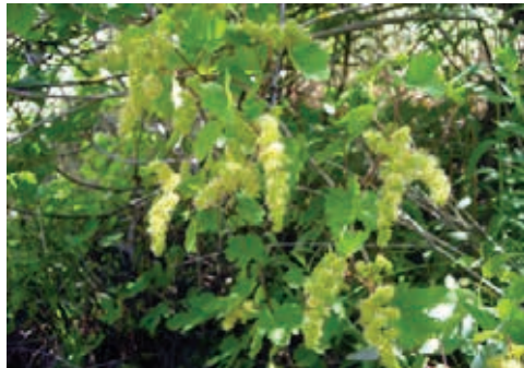
FOTO 1: Nota pie de imagen: Inflorescencia masculina.

La vid euroasiática se encuentra integrada por dos subespecies: una de ellas hermafrodita, llamada Vitis vinifera L. subespecie sativa (DC.) Hegi, y otra dioica, llamada Vitis vinifera L. subespecie sylvestris (Gmelin) Hegi. Esta última constituye el parental dióico de las variedades cultivadas, que corresponden, en su gran mayoría, a la subespecie sativa .