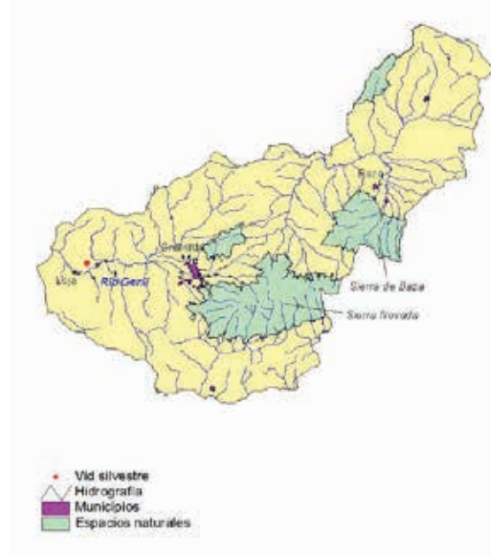
FOTO 10: Nota pie de imagen: Localización de las poblaciones de vid silvestre de la provincia de Granada.