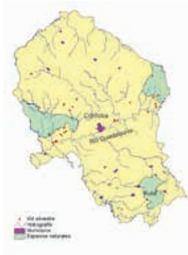
FOTO 4: Nota pie de imagen: Localización de las poblaciones de vid silvestre de la provincia de Córdoba.