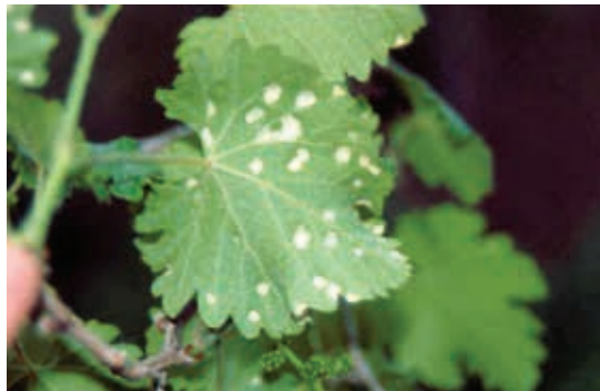
FOTO 11: Nota pie de imagen: Síntomas causados por Colomerus vitis

Durante el invierno, es frecuente encontrar yemas con ácaros hibernantes bajo las brácteas externas de las yemas.