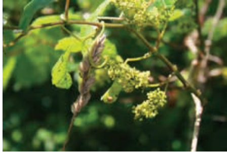
FOTO 2: Nota pie de imagen: Inflorescencia femenina.

Las poblaciones de vid silvestre eurasiática se extienden desde Portugal hasta el macizo del Hindhu Kush, también aparecen algunos núcleos en la región africana del Maghreb, como es el caso de la cuenca del río Ourika, en Marruecos, al pie de la cordillera del Atlas (Ocete et al., 2007).