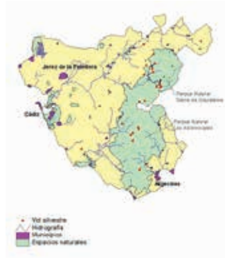
FOTO 5: Nota pie de imagen: Localización de las poblaciones de vid silvestre de la provincia de Cádiz.