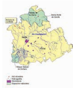
FOTO 7: Nota pie de imagen: Localización de las poblaciones de vid silvestre de la provincia de Sevilla.