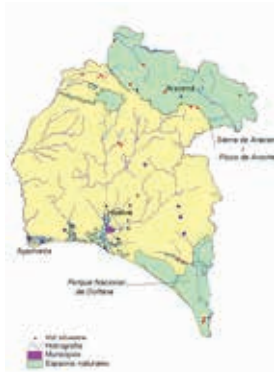
FOTO 6: Nota pie de imagen: Localización de las poblaciones de vid silvestre de la provincia de Huelva.