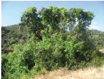
FOTO 3: Nota pie de imagen: Ejemplar de vid silvestre tutorado por acebuche (La Minilla, Sevilla).

En la Península Ibérica, los hábitats que albergan, todavía, un mayor número de poblaciones de vid silvestre, son los bosques de ribera, en donde se desarrollan como lianas utilizando como tutores a diversas especies arbustivas y arbóreas.