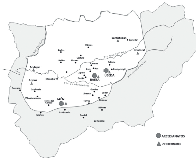
Mapa 2. Demarcación de obispado de Baeza, 1243

Aunque el obispo baezano ejercería su jurisdicción sobre el amplio territorio que se le asignó, alguno todavía sin conquistar, como es el caso de Jaén, y en el que se incluyeron todas las localidades que habían estado en litigio con el arzobispo de Toledo, a excepción de Martos, se desarrolló un complicado sistema de reparto por el que metropolitano gozó de algunos derechos en Úbeda y Andújar y el obispo de Baeza en Martos 50 .