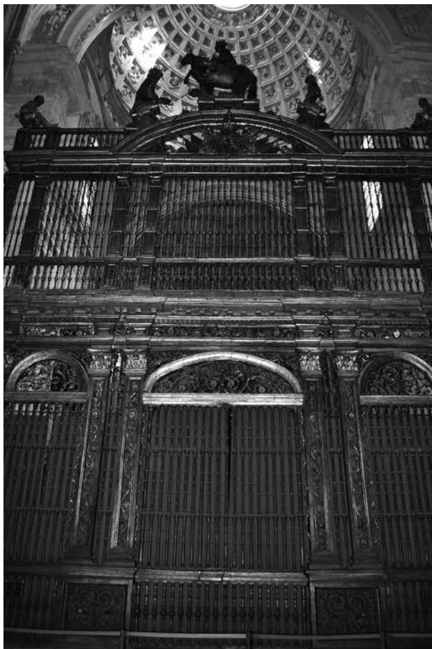
Fig. 2. Reja de la Capilla Real. Catedral de Sevilla. (Foto: autor).

desde Málaga, su aserrado, labrado y asentado para recubrir algunas zonas del enlosado deteriorado 31 .