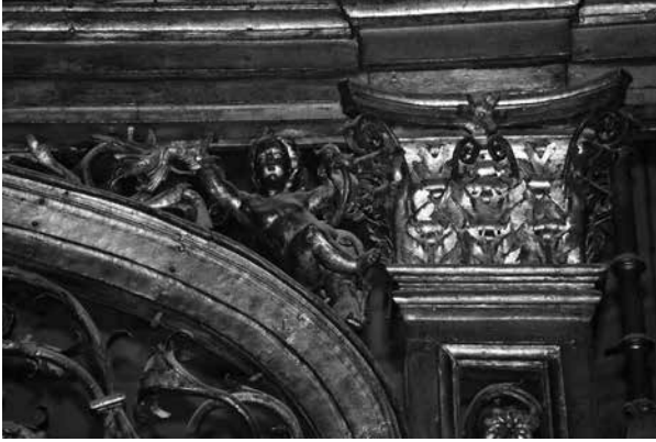
Fig. 3. Rēja de la Capilla Real. Detalle del primer cuerpo. Catedral de Sevilla. (Foto: autor).