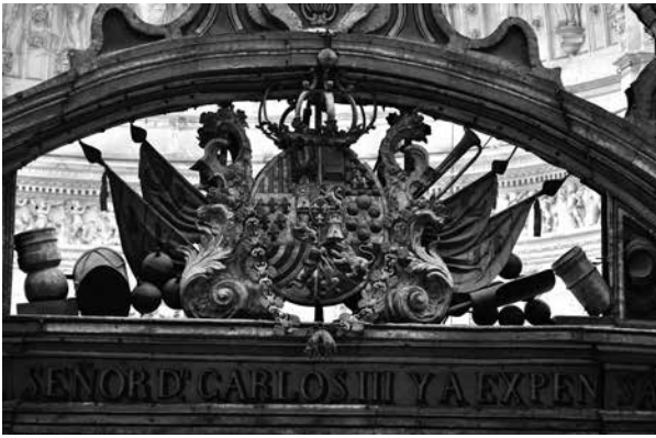
Fig. 4. Rēja de la Capilla Real. Detalle escudo de armas. Catedral de Sevilla. (Foto: autor).

1.450 reales 40 . El conjunto se remata con un ático, formado por una balaustrada que se dispone sobre las calles laterales. Este remate mide 2,94 m y pesa 1.501 kg 41 .