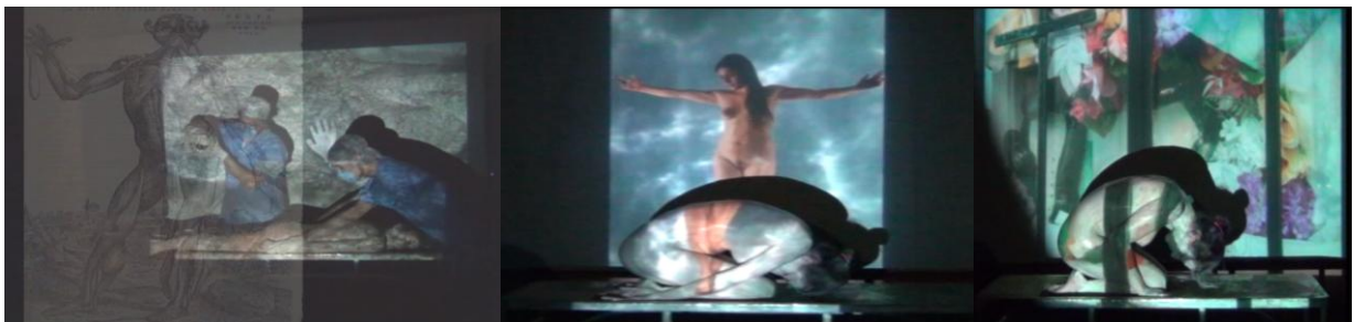
2 Montaje de citas integrado al (D)MT Los muertos enseñan a los vivos . 8 (2011)

El hecho de que los montajes que se vienen produciendo se realicen bajo formato digital permite ir más allá de la linealidad de los relatos y generar combinatorias de fragmentos de filmes producidos desde las primeras décadas del s.XX hasta nuestros días, junto con materiales audiovisuales generados en los ámbitos en los cuales trabajamos. También contamos con la posibilidad de liberar las imágenes de la tiranía del tiempo y descomponerlas en fotogramas, cambiar su orden o alterar su duración, siguiendo formatos afines a los del found footage (García Martínez, 2006). Estas posibilidades se extienden a las instancias de proyección, que pueden plantearse en pantallas tradicionales o sobre otra serie de soportes que juegan con infraestructuras arquitectónicas, cuerpos quietos o en movimiento, u otra clase de pantallas y escenarios que se diferencian de la caja oscura que es el cine y su gran pantalla espectacular. En este camino retomamos el eco de experiencias de la historia de la cinematografía vinculadas con el cine expandido (Youngblood, 1970; Alonso, 2011) y las instalaciones (Bonet, 1995; Gianneti, 2002). Esto permite que se puedan establecer diversas relaciones entre las imágenes, a lo largo de procesos de montaje, desmontaje y re-montaje (Didi-Huberman 2008), trascendiendo la linealidad de un video.