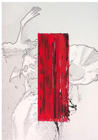
Figura nº 13. Cartel oficial de La Bienal.

En 2012 es el andaluz Guillermo Pérez Villalta el elegido. Este gaditano (1948), adecua su estilo personal al mensaje de la Bienal, por medio de la figuración, el color y la tan suya influencia de la geometría, la caligrafía y la arquitectura. El empleo de símbolos icónicos del flamenco lo acercan bastante al Pop. Destacable es del pintor, grabador y escultor Rafael Canogar (1935), donde una gran mancha abstracta de tono burdeos rompe en dos una imagen difusa en blanco y negro (figura nº 13). La mancha se convierte así en figura y el pensamiento resultante tiene fuerza y expresividad, así como mucha potencia visual.