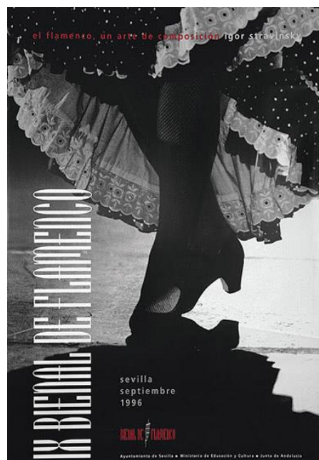
Figura nº 7. Cartel oficial de La Bienal.