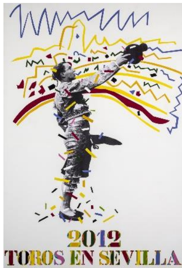
Figura nº 20. Cartel oficial de la Feria de Abril. Fotografía de la Real Maestranza