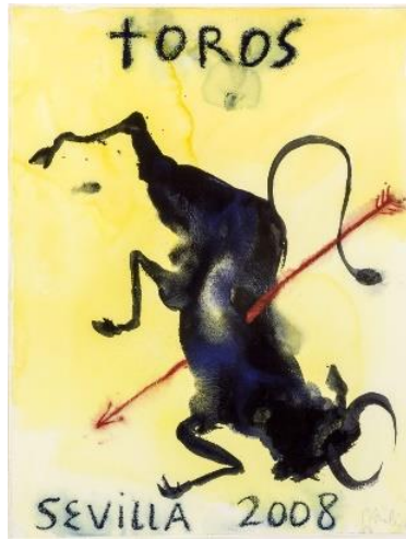
Figura nº 19. Cartel oficial de la Feria de Abril.