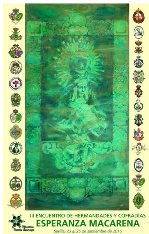
Figura nº 6. Cartel Esperanza Macarena. Fotografía de la Hermandad de La Macarena