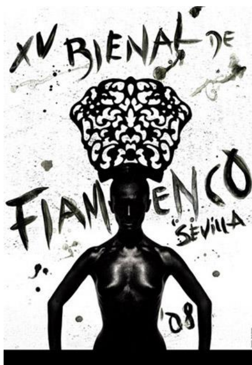
Figura nº 11. Cartel oficial de la Bienal.

De todos modos los dos son totalmente identificables con el trabajo y procedimientos usuales de sus autores. Posteriormente, los de 2008, 2010, 2012, 2014 y 2016 son completamente diferentes entre sí, pero conectados por un marcado carácter contemporáneo y postmoderno. Geometría, expresionismo, figuración, abstracción, mancha, línea, color y mucha fuerza para hacer llegar un mensaje: la idea justifica la obra. Rubén Afanador (1959) firmó el cartel de 2008 donde se combina fotografía y pintura en blanco y negro. Dicho cartel sigue hoy en día dando que hablar por original y transgresor. Sin duda, este trabajo ha traspasado la frontera del flamenco y de la propia Bienal por su carga artística (figura nº 11).