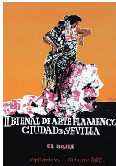
Figura nº 14. Cartel oficial de La Bienal. Fotografía de la Bienal

y blancos trasciende creando una división en dos sobre el fondo. En parte naranja, en parte negro. Para ahondar en el mensaje, incluye el lema "El BAILE". Y es que el festival, cada edición contiene un tema que lo justifica. En aquella edición de 1982, se dedica al baile flamenco (figura nº 14).