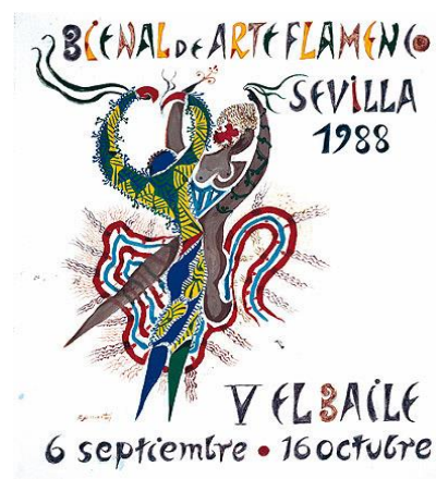
Figura nº 15. Cartel oficial de la Bienal.

Como curiosidad, el cartel de la Bienal contiene anécdotas. Una de ellas es que en la edición del año 1984, el cartel oficial sería un boceto realizado por el artista Manuel Ángeles Ortiz (1895-1984). Y es que el mismo falleció durante la realización del encargo, por lo que la organización de la Bienal de aquellos entonces, decidió a modo de homenaje, emplear como obra definitiva uno de los bosquejos que había realizado antes de morir. O el cartel de 1988 (figura nº 15) confiado al reconocido poeta Rafael Alberti (1902-1999).