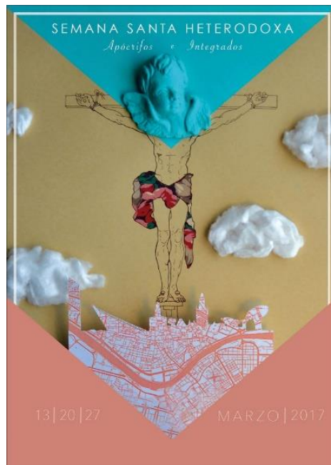
Figura nº 1. Semana Santa Heterodoxa-apócrifos e integrados .