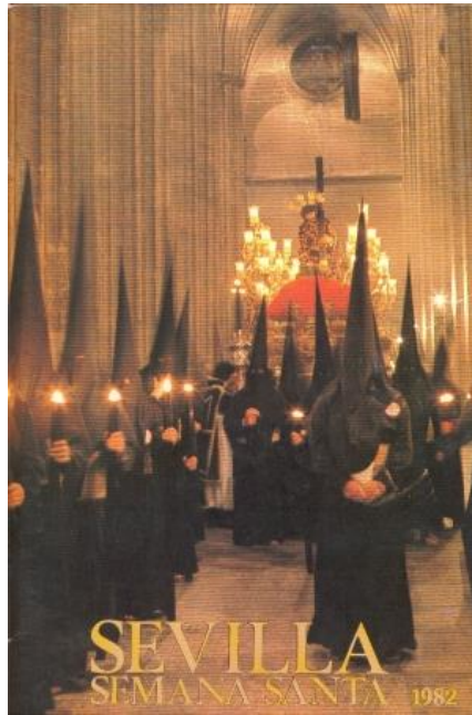
Figura nº 8. Cartel oficial Semana Santa de Sevilla 1982..