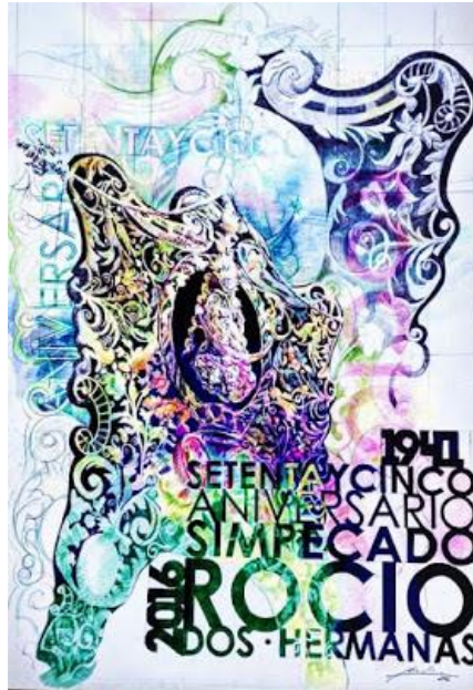
Figura nº 3. Cartel 75 aniversario bendición simpecado Rocío. Fotografía del autor