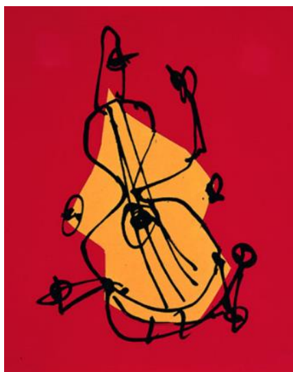
Figura nº 10. Cartel oficial de La Bienal.

El Excmo. Ayuntamiento de Sevilla organiza cada dos años La Bienal de Flamenco. Pese a la juventud del mismo, desde 1980, se trata del festival más importante e internacional del género flamenco. Con más solera junto al Festival del Cante de las Minas de la Unión (Murcia). Para dar publicidad al mismo, el organismo organizador encarga la realización del cartel oficial de la Bienal ha ido arraigando poco a poco dentro de los sevillanos y el resto de aficionados al flamenco. Aun así no alcanza el nivel de aceptación y popularidad si se compara con otros. A lo largo de las 18 ediciones celebradas hasta ahora, la próxima será en 2018, el cartel anunciador ha sufrido una evolución estética. La mayoría son pinturas y dibujos, o mixtos, con sólo tres las veces, que hasta ahora, en los que la fotografía ha sido la protagonista: 1986, 1992 y 1996. Desde el que realizó el oscene Antonio Saura (1930- 1998) en 1990, acentuado (figura nº 10) por el de Luís Gordillo (1934) en el 2000, existe total variedad y libertad creativa. Ambos casos son ejemplos de carteles donde la imagen se explica por sí sola. Sin texto. Composiciones donde la abstracción y el color estructuran un mensaje a través de la expresividad de la línea.