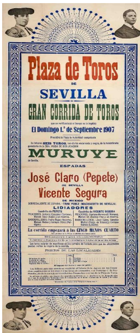
Figura nº 18. Cartel toros. Fotografía de la Real Maestranza

autores desconocidos y poco relevantes. Algo que se da en los carteles de otras plazas de toros de España como Las Ventas de Madrid, o Barcelona.