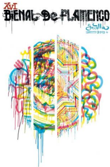
Figura nº 12. Cartel oficial de La Bienal.

sus proyectos y estilos personales de un simbolismo y una carga social, convirtiéndolos así en algunos de los mejores pintores de arte urbano del momento.