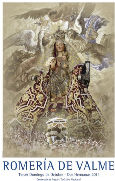
Figura nº 9. Cartel oficial Romería de Valme 2014.

A continuación, vamos a desglosar el cartel sevillano por medio del flamenco, y el cartel taurino. Una pequeña selección de entre los múltiples ejemplos de carteles que se editan y publican anualmente por motivos de tiempo. Otros grandes carteles, con interés plásticos, son religiosos como el de la Semana Santa, Las Glorias de Sevilla, el Día de la Virgen o el Corpus Christi. O festivales como la Cabalgata de Reyes o la Fiestas de Primavera.