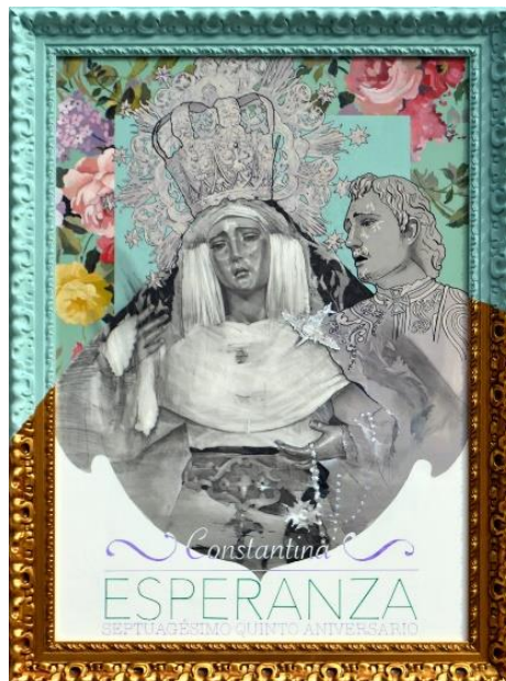
Figura nº 2. Cartel Esperanza .