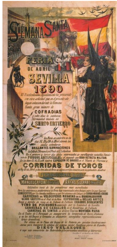
Figura nº 17. Cartel de la Fiesta de Primavera.

En los años sucesivos, el cartel taurino continuará el modelo de compositivo iniciado por García Ramos. Un ejemplo, el cartel de Primavera de Gonzalo de Bilbao (1860- 1938) en 1907. A partir de entonces, los carteles taurinos seguirán ligados al cartel de las Fiestas de Primavera con más o menos asiduidad, como parte de la Feria de Abril. Hoy en día sigue vigente esta relación, como se ejemplifica en el cartel de las Fiestas de la Primavera de 2015, obra de Francisco Ayala (1964).