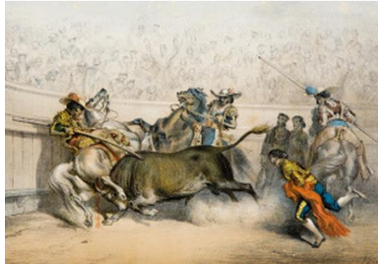
Figura nº 16. Tauromaquias . Fotografía de la Real Maestranza

del desarrollo de las corridas, así como retratos de toreros, picadores, y las primeras plazas urbanas.