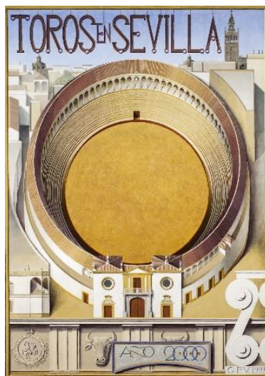
Figura nº 21. Cartel oficial de la Feria de Abril. Fotografía de la Real Maestranza