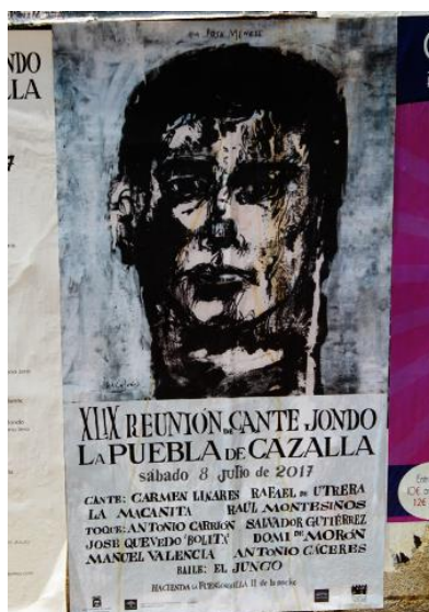
Fotografía nº 16. Cartel oficial Reunión del Cante Jondo.

Dichos espectáculos son organizados por Ayuntamientos y agrupaciones de localidades sevillanas, y editan su propio cartel en los que transmiten y venden este producto que cuidan por el interés turístico. Como es obvio, se tratan de carteles informativos en donde priman la exposición y venta del producto más que la búsqueda plástica. Así como sus autores no suelen ser conocidos. Es lo que le diferencia del cartel de la Bienal. Sin embargo indirectamente, como toda creación, contiene un atractivo que los hacen únicos. Relevantes son los del Festival Flamenco de la Sierra Sur, "Carocolá" Iebrijana; Gazpacho andaluz de Morón de la Frontera (Sevilla); o el Potaje Gitano de Utrera (Sevilla).