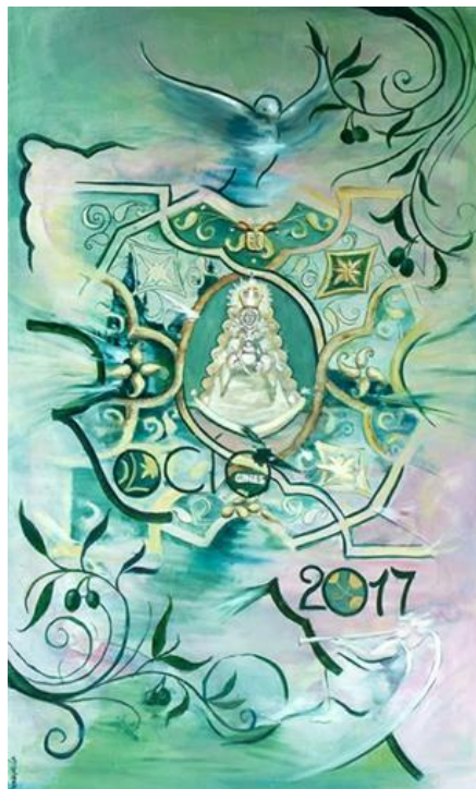
Figura nº 5. Cartel oficial Romería del Rocío 2017- Hermandad de Gines.