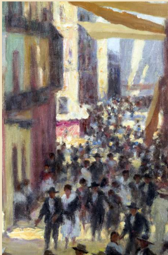
11. Santiago Martínez Martín. Vista de la calle Sierpes desde el Círculo Mercantil e Industrial (detalle) . 1968. Cat. 15.

La exposición de Santiago Martínez se inauguró el 5 de marzo de 1968 94 . En la crítica que le realizara Manuel Olmedo se destacan la filiación sorollesca de su pintura sin ser servilmente imitativa, la esencialidad de la luz en su producción y la vibración de su matérica pincelada 95 . Precisamente, uno de los cuadros que se reproducían en dicha crónica, Vista de la calle Sierpes desde el Círculo Mercantil e Industrial , terminó por regalárselo a la institución 96 , con una dedicatoria que dice: “Al Presidente del Círculo/ Mercantil e Industrial/ de Sevilla. Santiago Martínez/ Marzo 1968” (Cat. 15).