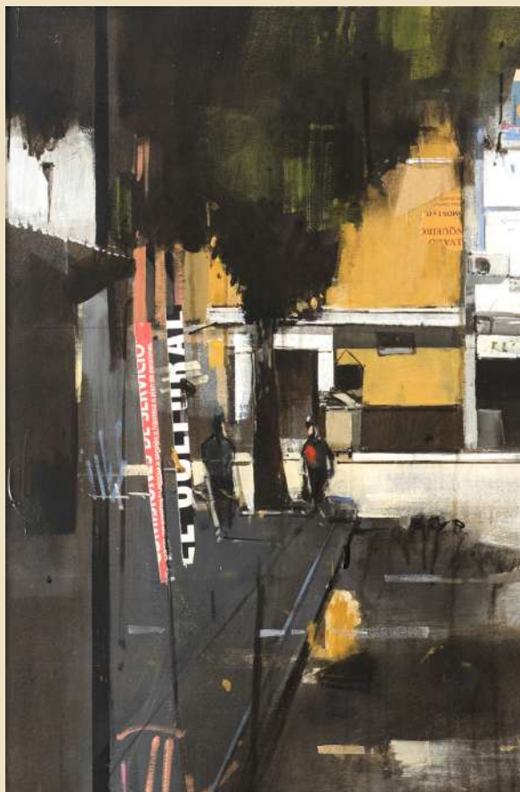
14. Antony Samelian Kerikourian. Plaza de la Alfalfa (detalle) . 2006. Cat. 26.

Española de Círculos y Casinos Culturales, celebrado en Sevilla en 2006, y el Cartel del 150 aniversario fundacional del Círculo Mercantil e Industrial de Sevilla (Cat. 31), concebido en 2017 por el pintor castilblanqueño Miguel Ángel González Romero (1978) para conmemorar en 2018 el sesquicentenario que justifica la celebración de la presente exposición.