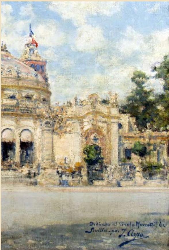
4. José Arpa Perea. Casino de la Exposición (detalle). 1929. Cat. 3.

iberoamericano, esto es, el 9 de junio de 1929, día elegido para la inauguración de la exposición de pinturas de José Arpa “en el nuevo salón” del Mercantil 36 . En la muestra, que permaneció abierta quince días, Arpa expuso una treintena de cuadros, algunos de los cuales se había traído desde América y otros eran de reciente factura en Sevilla y Alcalá de Guadaíra 37 . A los pocos días de clausurarse, se leyó en la junta del 4 de julio una carta de Arpa, donde expresaba “su más profunda y sincera gratitud por haber puesto a su disposición el nuevo salón de actos, y acompañando un hermoso cuadro dedicado a este Centro Mercantil, como recuerdo de la Exposición Ibero-Americana”; en correspondencia, se le oficiaría en agradecimiento “por su delicada atención, al dedicar a este Centro una de sus maravillosas obras, y comunicarle que será colocada en sitio preferente” 38 , decidiéndose que fuese “en la sala dedicada a la Presidencia” 39 . El lienzo en cuestión, que aparece en su ángulo inferior derecho “Dedicado al Círculo Mercantil de Sevilla por J. Arpa”, representa la fachada principal del Casino de la Exposición, en una visión exultante de luminosidad y color, constituyendo, a nuestro entender, una de