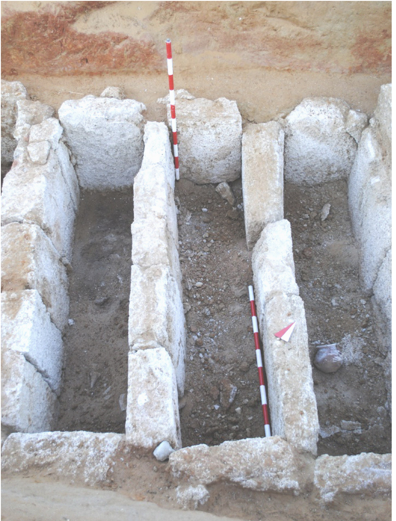
Figura 3. Detalle del conjunto funerario II mostrando los enterramientos E39, E40 y E41, pudiendo apreciarse la mala conservación de los restos óseos y las técnicas constructivas empleadas.