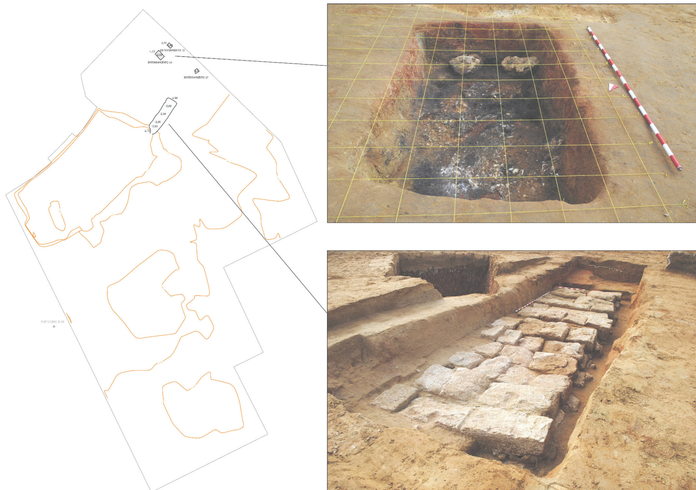
Figura 2. Localización de las cremaciones fenicias y de los conjuntos funerarios I y II de época púnica en el solar (planimetría base y fotografías de R. Belizón).

que se han identificado con restos de la Segunda Contraguardía, la Primera Contraguardía y las minas y contraminas de las murallas construidas a partir de 1731.