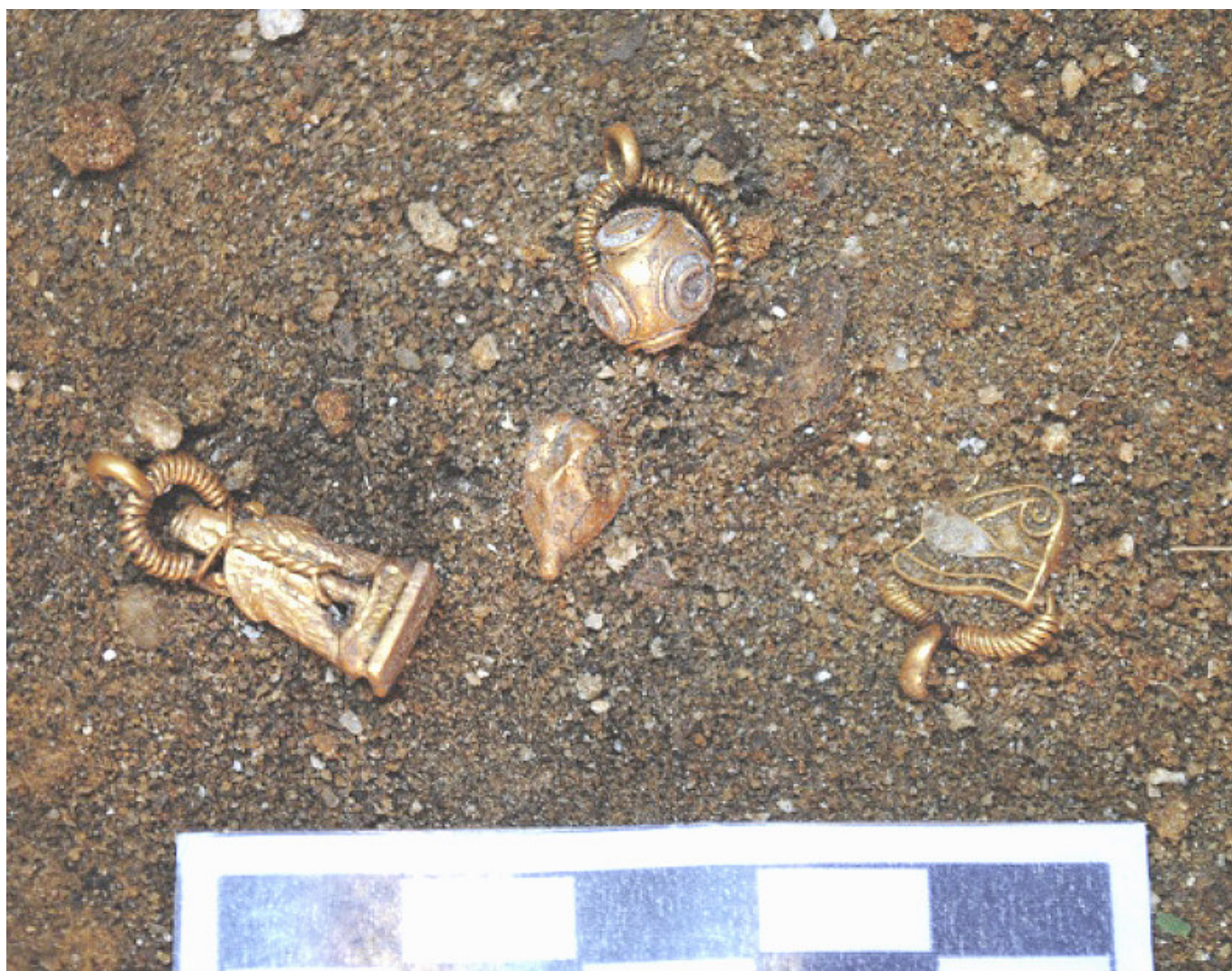
Figura 4. Imagen de algunos de los ítems de joyería (posicionados in situ ) documentados como parte del ajuar del enterramiento E40 del conjunto funerario II.

(enterramientos 14, 15 y 17) excavados en la base geológica arcillosa. En ninguno de los casos se documentaron restos de ajuar, estando los restos óseos muy deteriorados debido a las altas temperaturas alcanzadas en la pira. Se trata de un tipo de enterramiento ampliamente conocido en la necrópolis insular de Gadir, siendo mayoritariamente fechado entre finales del siglo VII y la primera mitad del VI a. C. (Torres 2010; Botto 2014).