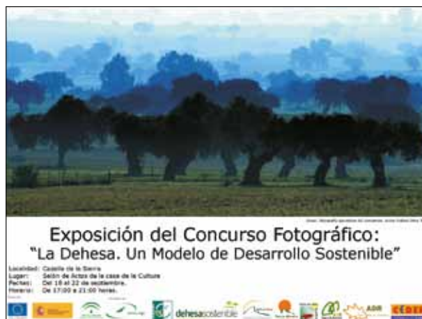
Fig. 2. El paisaje de la dehesa utilizado como factor de desarrollo territorial.

Estas nuevas significaciones ambiental y paisajística se relacionan con otra acepción hoy también muy potente, la institucional. La creciente preocupación ciudadana por la seguridad y salubridad alimentarias ha convertido a la dehesa en proveedora de alimentos de calidad, certificados como producciones ecológicas, denominaciones de origen, indicaciones geográficas protegidas..., todo ello con el apoyo público de las medidas de la PAC: primas ganaderas, programa de reforestación de superficies agrarias, ayudas agroambientales... A su vez, su enaltecimiento por el ambientalismo ha llevado a la catalogación de sus paisajes como Paisaje Agrario Singular, Área de Interés Ambiental y Paisajístico, Espacio de Protección Compatible, Parque Natural, Reserva de la Biosfera dentro del Programa MaB de la Unesco... Sin pretender ser exhaustivos, son igualmente numerosas las acciones de desarrollo rural (antiguas iniciativas Leader y Proder) que, en un intento de corrección de los