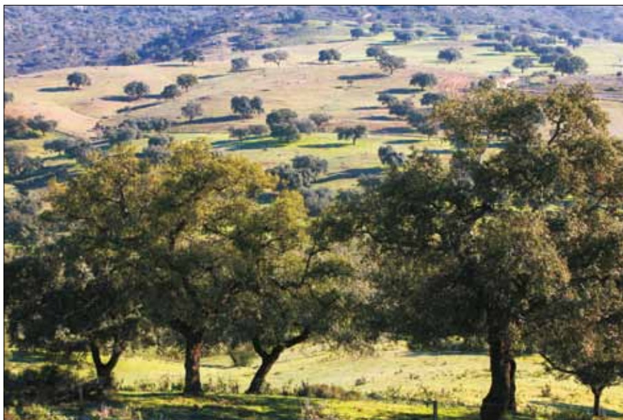
FIG. 1. El paisaje de la dehesa.

institucional, aunque era objeto de un especial mimo y cuidado por parte de los propietarios y hacedores de un agrosistema poco productivo en términos agronómicos, pero con grandes cualidades culturales, ambientales y paisajísticas. Estos dos últimos son precisamente los méritos que hoy se le reconocen, priorizándose los aspectos ambientales-naturalísticos y estético-paisajísticos de la dehesa, al tiempo que su carácter funcional-productivo y el extraordinario patrimonio cultural sustentador de aquellos otros valores se relegan a un segundo plano.