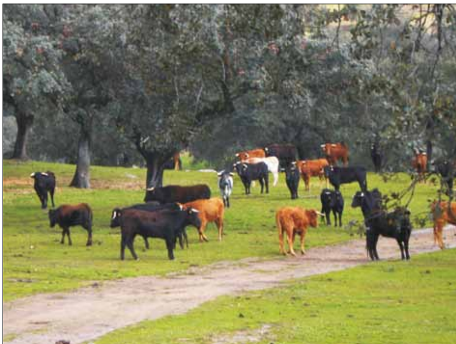
FIG. 5. La dehesa es un paisaje ganadero.

tiva, en que el árbol es objeto de una primera poda que elimina las ramificaciones laterales y permite diferenciar el tronco principal que sostiene la copa. La propia forma de la copa también se relaciona con las podas: cada diez a catorce años se realiza una poda drástica (el desmoche), que descarga al árbol de la mayor parte de su fronda y remodela su forma, dejando de tres a seis brazos principales que soportan una copa semiesférica. A los cuatro o seis años del desmoche la encina recibe una poda más liviana (el olvido), consistente en la limpieza de los chupones. Obviamente, se trata de unas labores que se acometen sin pretensión estética alguna y que se relacionan con el aprovechamiento ganadero de la dehesa: obtención de la máxima producción de bellota en el caso del desmoche y limpieza y acceso del ganado en el del olvido. Otra práctica necesaria para la conservación de la dehesa, además de la poda de los árboles, es la limpieza del matorral (aproximadamente cada cuatro años), cuyo avance impide que crezcan los pastos y dificulta el paso de los animales.