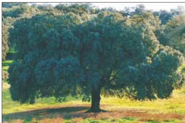
FIG. 4. Fisonomía de la encina en la dehesa.

del mismo, aunque no siempre se deje ver a causa de la movilidad inherente a su condición de sistema ganadero extensivo. Está integrada por diversas especies (porcinos, vacunos, ovinos, equinos, toros de lidia, animales introducidos para las monterías...) cuyo predominio y combinación dependen del tipo de dehesa y de las circunstancias de su explotación histórica.