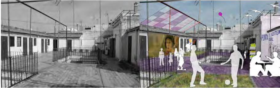
Fig. 9 Corral Go, 2015. Martínez-Quesada, MC. (Archivo propio)

En esta iniciativa las cubiertas representan la necesidad de privatizar parte del espacio exterior natural y poder vivirlo en la ciudad sin tener que salir fuera de ella. Retrata la creación de un jardín utilizable por el alojamiento, y no de un paisaje natural que se observa siempre fuera de éste.