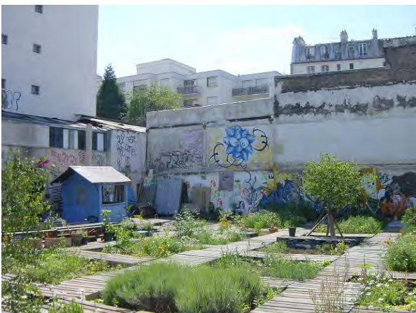
Fig. 3 Espacio promovido por el Programa Charte Main Verte, Paris. Fig. 3 http://lartichaut.net/IMG/jpg/ecobox.jpg visitado el 20-07-2017

La primera apropiación de un espacio comunitario se manifiesta por la colocación intencionada de un elemento verde para significar un lugar propio frente al resto. Pero cuando esta acción se expande, mediante una voluntad común, hace de los espacios de encuentro verdaderos jardines interiores domésticos dotados de un significado propio que se ve reforzado por el proceso de interacción con el resto de la comunidad, haciendo de esta personalización una aproximación a un proceso de identificación.