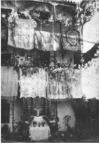
Fig. 1 Ornato de un corral de la calle Caballerizas. Año 1956. http://www.redes-cepalcala.org/ciencias1/imagenes4/corrales/casco_antiguo/procesion.jpg visitado el 20-07-2017 Fig. 2 Interior en Purezza 48. Año 2015.