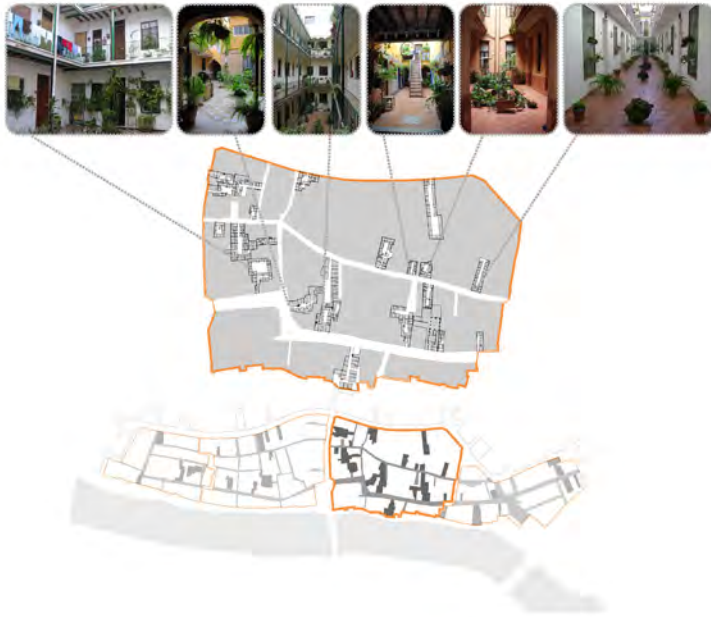
Fig. 7 Cartografía de lo verde. Corrales de vecinos de Triana, 2016. Martínez-Quesada, MC. (2016)