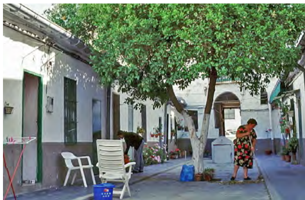
Fig. 6 Uso doméstico de patio central.

Instituto Andaluz del Patrimonio Histórico: Base Patrimonio Inmueble de Andalucía. Sevilla. http://www.iaph.es/imagenes-patrimonio-cultural-andalucia/imagen.php?i=21248&a=2219&alt=533&anc=812&flv=no visitado el 20-07-2017