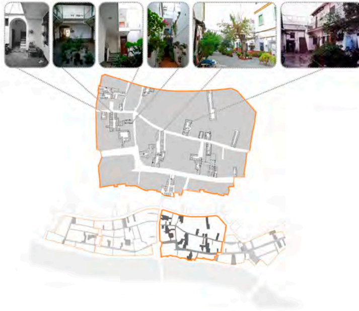
Fig. 8 Cartografía de lo verde. Corrales de vecinos de Triana, 2016. Martínez-Quesada, MC. (2016)