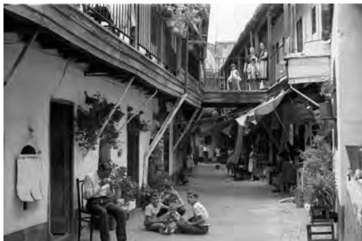
Fig. 4 Colonización de galería de forma privativa. ño 2015. Martínez-Quesada, MC. (Archivo propio)