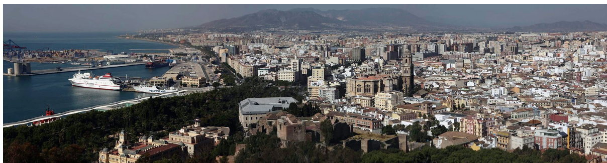
Figura 2. Vista general de Málaga