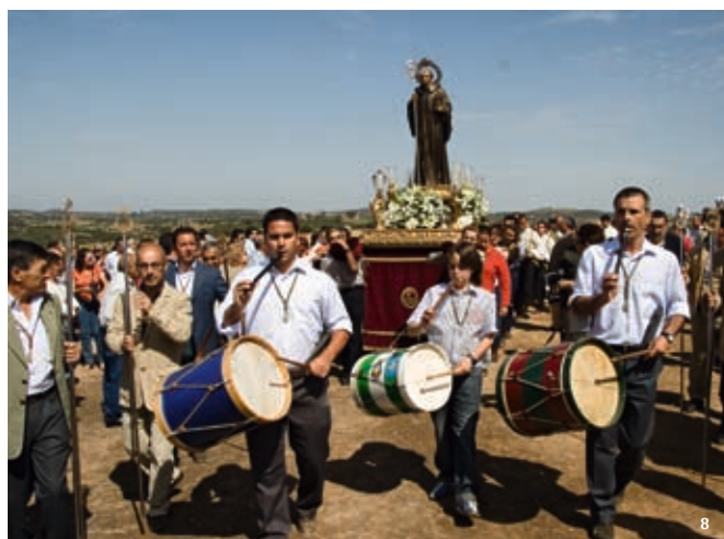
1. Chaleco danzante de San Bartolomé de la Torre.