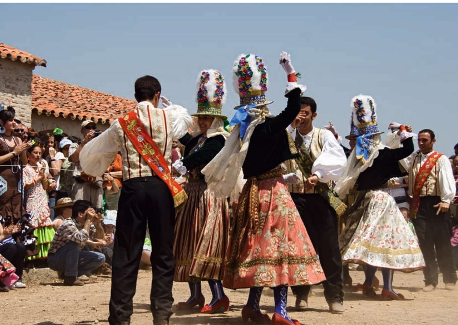
Baile de Folia en la Romería de San Benito (Cerro de Andévalo).