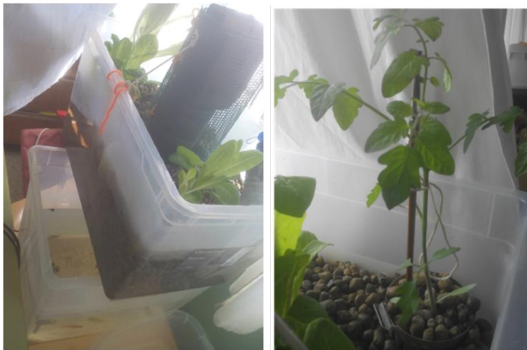
Figuras 2 y 3. Sistema acuapónico maduro

Nuestra sorpresa fue mayúscula pues, al cabo de las semanas, los niveles del test de nitratos se mantenían cercanos a cero y la lechuga tenía un aspecto muy saludable y comenzaba a crecer. Por ello, con este mismo procedimiento gradual y, aprovechando la primavera, añadimos dos peces más y más plantas de lechuga y de tomate cherry al sistema. Las lechugas crecieron bien (figuras 2 y 3), sin embargo, el tomate cherry tuvo más dificultades y las flores no cuajaron, creemos que pudo ser debido o bien a falta de sol, por encontrarse dentro de un aula, o a la falta de nutrientes, escasez de peces.