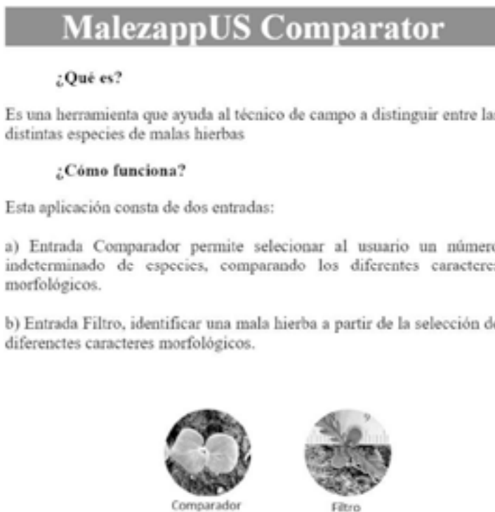
Figura 2. Pantalla de entrada de la aplicación.

A continuación, se muestra una serie de figuras con los distintos pantallazos si se elige la opción COMPARAR (Fig. 2 a 4).