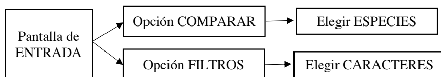
Figura 1. Diseño de funcionamiento de la aplicación.

2.1. Diseño de la app. Una vez se entra en la aplicación, ésta ofrece al usuario la posibilidad de elegir entre la opción COMPARAR o FILTROS. Si se elige la opción COMPARAR, aparece otra pantalla con el listado de especies donde el usuario selecciona las que desea comparar. Si se elige la opción FILTROS, la aplicación debe de mostrar los distintos tipos de caracteres morfológicos para realizar el filtrado de especies arvenses (Fig. 1).