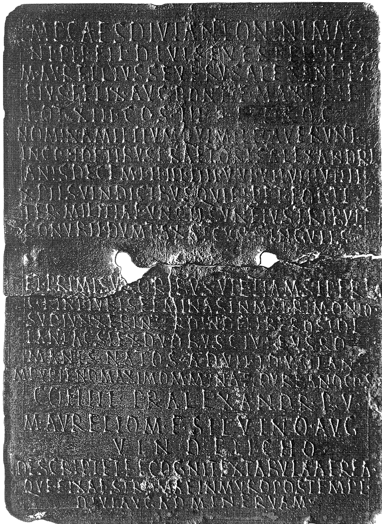
Fig. 1. Tabella, extrinsecus.