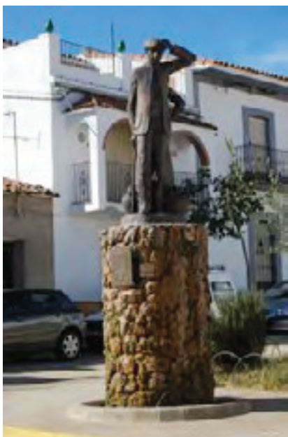
El concejil de Aracena