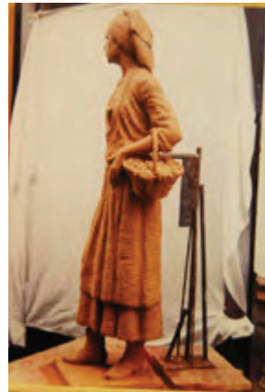
Apañadora en los marines