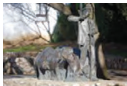
Hortelanos de la Nava