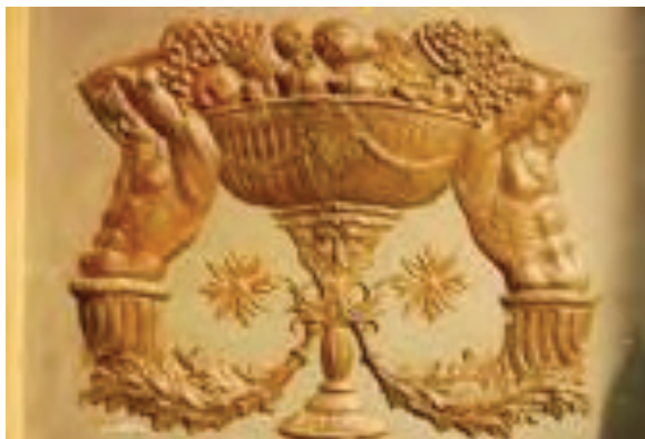
Cancela de la Parroquia de la Asunción