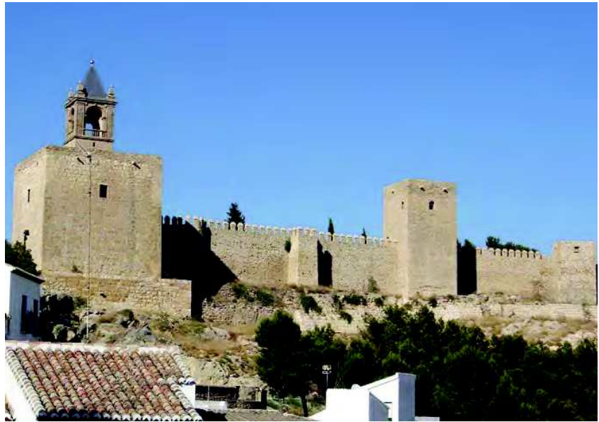
Imagen actual de la Alcazaba de Antequera que tuvo que rendirse al ejército castellano.

En realidad, desde el fracaso ante los muros de Setenil en el año 1407, el infante