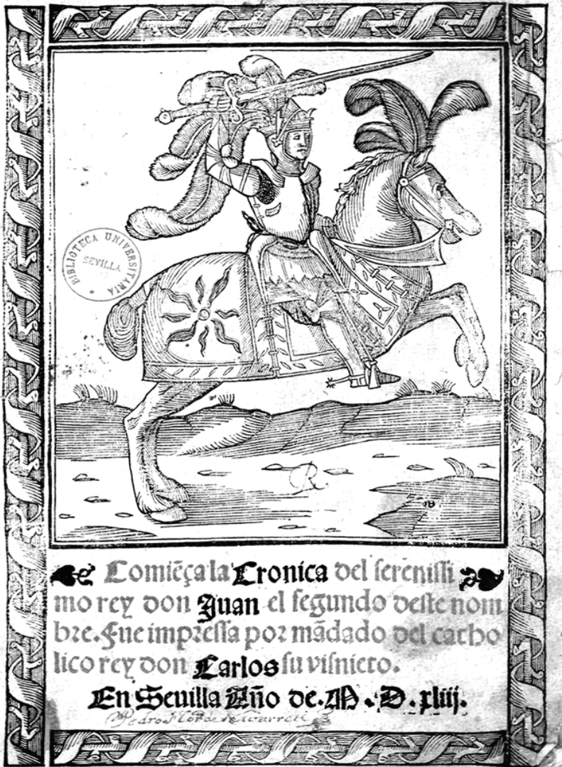
La Crónica de Juan Segundo describe al detalle el día a día de la toma de Antequera.