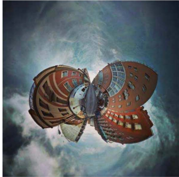
Fig.1 Mi casa mi mundo 07. Madrid. 2014