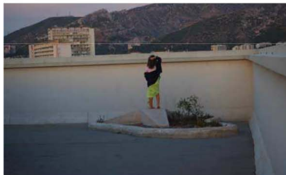
Fig. 4 Niña lanzando objetos más allá de la barandilla. Cubierta de la Unidad de Habitación de Marsella. 2015.

... en esta morada suya, sólo El y el alma se gozan con grandísimo silencio (7M 3,11) (Camina del Amo 2013, Teresa de Jesús 1968).