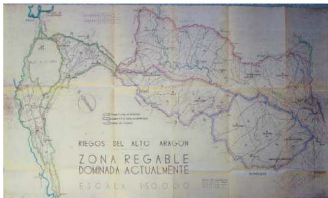
Fig. 1 Zona regable Monegros-Flumen