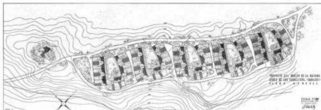
Fig. 2 La bazana, Alejandro de la Sota

Sobre este aspecto destacamos la reflexión de Antonio, Álvaro Tordesillas 8 , en la que plantea que existe una evolución cronológica en los planteamientos del INC, que hace evolucionar el concepto de centro cívico o plaza mayor hacia un concepto más abierto de espacio público o corazón de la ciudad, en el que la relación del espacio público con su entorno inmediato y con la ordenación general del pueblo es más complejo y evolucionado que el tradicional de la plaza mayor.