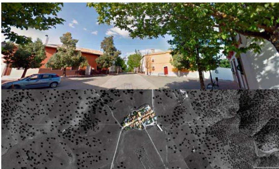
Fig. 7 y 8. Estructura fundacional: Foto aérea actual Isabela (Feligresía La Carolina). https://www.google.es/maps/place/23214+La+Isabela,+Jaén/ . Accessed 01Jul 2017.