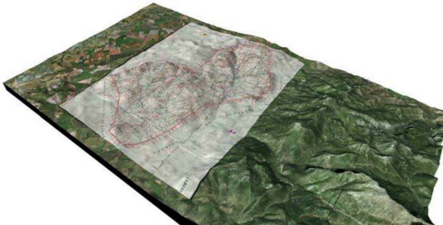
Fig. 3. Modelado del término municipal de Prado del Rey mediante QGIS 2 ThreeJS. Base del Modelo Digital de Andalucía e imagen satélite Bing Maps Aerial 2017. Superposición del término municipal actual y cartografía de 1912 (Instituto Geográfico y Estadístico. IECA1989002823) tras su georreferenciación. Vista sudeste.