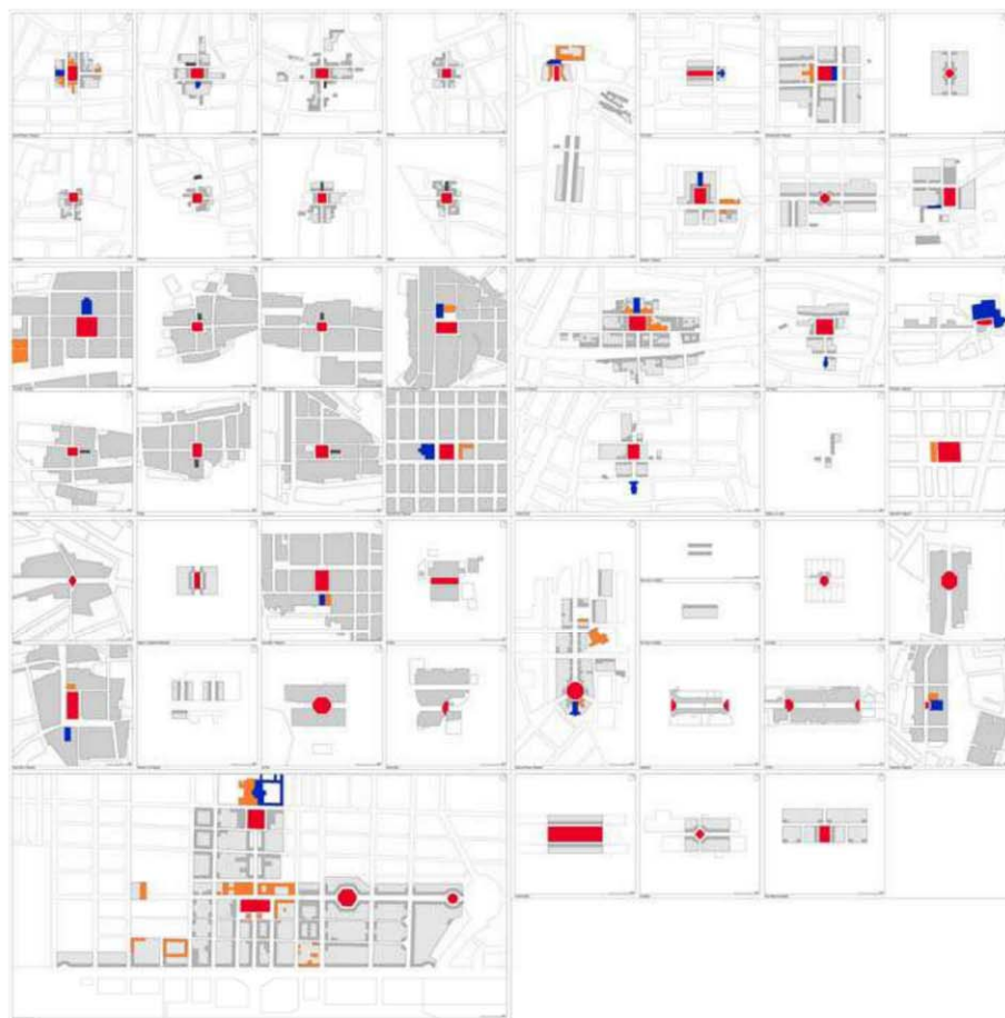
Fig. 4. Esquemas de las Nuevas Poblaciones de Colonización de Sierra Morena y Andalucía, Elaboración propia a partir de la superposición de la cartografía histórica georreferenciada sobre el parcelario catastral actual (junio 2017).

Se pueden constatar interesantes variaciones en base a las proporciones de las manzanas y a la disposición de las plazas, variaciones que reflejarían la facilidad del esquema general para adaptarse a las condiciones específicas de cada asentamiento, tanto de orientación como de orografía. Sin apartarse de la ortogonalidad de la trama, la morfología urbana es rica y variada en los núcleos de las nuevas poblaciones de colonización: el trazado se configura como un modelo formal para la construcción de la urbe y sus posibilidades de ampliación sucesivas desde el núcleo original consolidado (fig. 4).