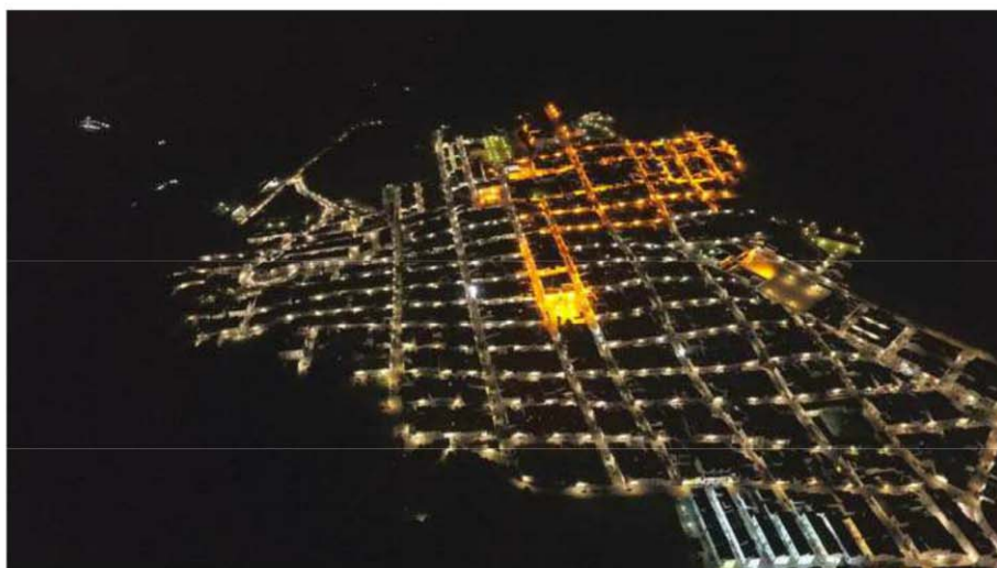
Fig. 1. Fotografía urbana actual del núcleo urbano de Prado del Rey (Cádiz, España).

El diseño de estas Nuevas Poblaciones era realizado por ingenieros militares dentro de una estrategia general de asentamiento territorial que se desarrollaba a partir de un único eje principal de comunicación, que permitía orientar una malla ortogonal en cuyo centro geométrico se insertaban los edificios del poder eclesiástico, político y económico asociados a la plaza (fig. 1).