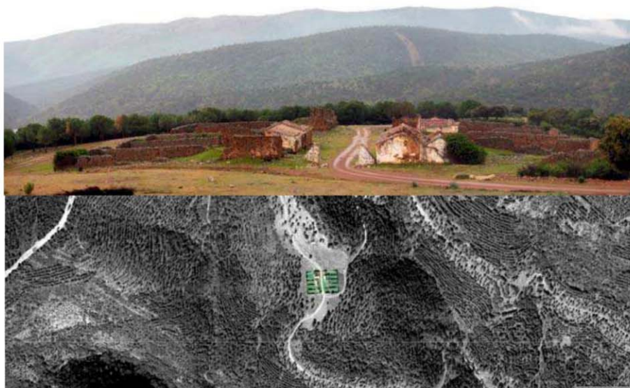
Fig. 11 y 12. En Ruinas: Foto aérea y actual de Magaña (Feligresía de Santa Elena). https://www.google.es/maps/search/magaña+santa+elena/ . Accessed 01Jul 2017.