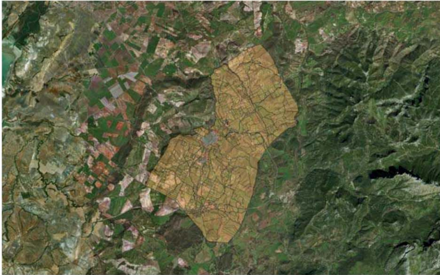
Fig. 2. Planimetría del catastro actual (junio 2017), a partir de la georreferenciación de la misma mediante el software QGIS (v. 2.18.7) y sistema de coordenadas ETRS089, EPSG3042 sobre foto aérea (Bing Maps Aerial 2017). Término municipal de Prado del Rey. E/1:150000.

A continuación, se detallan los esquemas de las tramas urbanas de los núcleos de distintas feligresías y aldeas representadas en sus levantamientos de las Nuevas Poblaciones de Colonización de Sierra Morena y Andalucía, que nos servirán para realizar un análisis comparativo sobre las similitudes y diferencias entre unos y otros a fin de valorar los atributos de este tipo de urbanismo ilustrado.