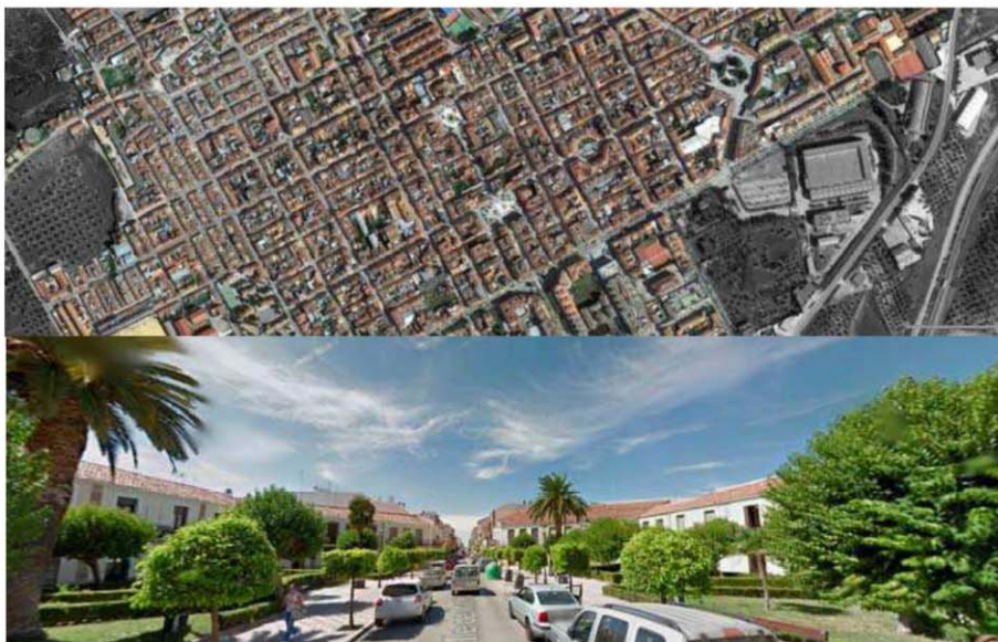
Fig. 5 y 6. Extensión de la estructura fundacional: Foto aérea y actual de La Carolina (Plaza de los Jardinillos). https://www.google.es/maps/place/23200+La+Carolina,+Jaén/ . Accedid 01Jul 2017.

5) Poblaciones en ruinas o desaparecidas. Gracias a la georreferenciación realizada para el análisis territorial se ha podido conocer la posición original exacta de pequeños núcleos ya desaparecidos como Buenos Aires, La Cruz o Tamujosa (fig. 11, 12).