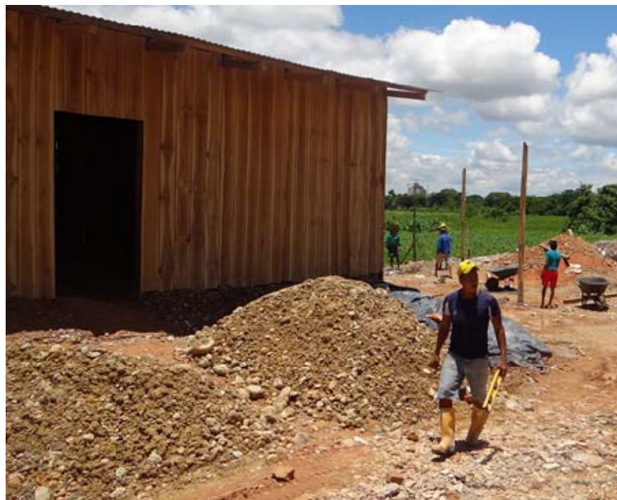
Fig.4 (Building of public space. Author: David Burbano G.)

- The formation of public space based on social appropriation. In these settlements, the community first takes over free spaces through activities of leisure, meetings for the community, etc. and over time, the space is physically configured (lighting, furniture, etc.), contrary to what occurs in traditional land-use planning where the space is first designed and physically completed and later appropriated by individuals.