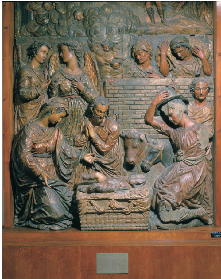
Fig. 2. Relieve de la Adoración de los Pastores del retablo mayor de la parroquia de Nuestra Señora de Consolación de Cazalla de la Sierra. Museu Frederic Marès. Barcelona (Autor de la imagen © Museu Frederic Marès. Barcelona).

nico era deudor de las composiciones de Oviedo 12 . Por lo tanto, de esta labor conjunta tan sólo quedan los relieves salvados del desgraciado retablo de Cazalla (fig. 1), en los cuales ya se había intuido la presencia de Montañés. De hecho, el de la Adoración de los Pastores (fig. 2), que hoy se encuentra en el Museo Marés de Barcelona, se había atribuido al maestro alcalaíno antes de su identificación como perteneciente al altar de Cazalla y su consiguiente adjudicación al catálogo de obras de Oviedo y de la Bandera 13 .