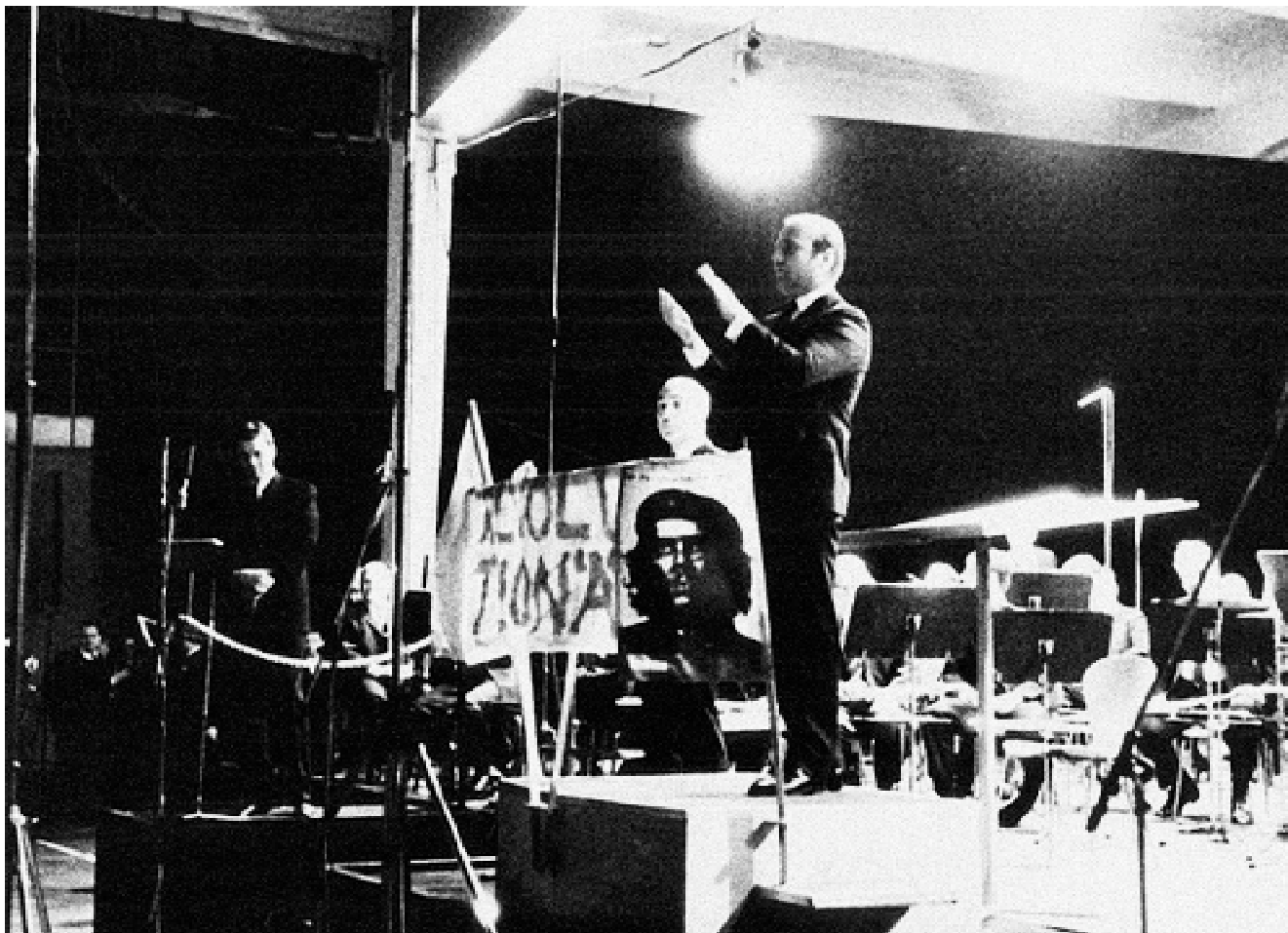
Estreno de la ópera Das Floß der Meduse , de Hans-Werner Henze, en Hamburgo en 1968.

negal. El texto se sirve del diario que escribió uno de los supervivientes, y que se publicó poco después en París. Relata cómo el capitán, los oficiales, los empleados del régimen y los curas se habían salvado en las barcas salvavidas, abandonando a su suerte en una balsa improvisada a marineros, soldados, mujeres y niños, que murieron casi todos tras una larga agonía. Este hecho originó una gran indignación en la opinión pública francesa y europea de entonces y contribuyó al clima revolucionario de la época. Al componer esta música, Henze se sirve como inspiración de la pintura Le radeau de la Meduse del francés Théodore Géricault, que recoge una escena de la tragedia, hombres desnudos o semidesnudos al borde del agotamiento, momentos de desesperación y esperanza, en el que un hombre —el protagonista Jean Charles en la obra— pide ayuda con un trapo rojo a un posible barco salvador. El oratorio, dedicado al Che Guevara, es una alegoría en la que se canta heroica-