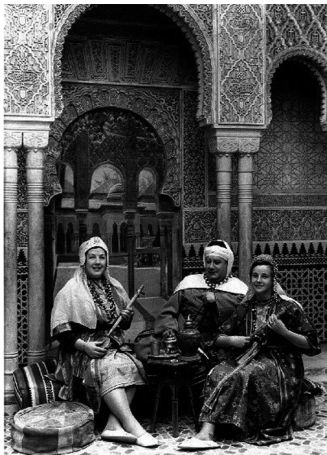
Turistas caracterizados para fotografía en la Alhambra, Granada.

La problemática se agudizó con la llegada de la segunda mitad del siglo XX. Y es que el resto de Europa estaba entrando en una era de prosperidad y bonanza económica, pero a la vez se había visto sometido a un involuntario proceso de homogenización que la desproveía, según muchos intelectuales, de su individualidad. Por ello, la mayoría de los viajeros coincidían en que España, a pesar de su estructura social obsoleta y anquilosada, no había sucumbido a los excesos de la civilización moderna y no se había visto apisonada por la gran maquinaria europea.