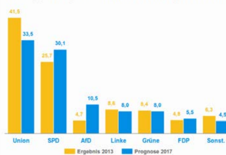
Bundestagswahl: Ergebnisse der Wahl 2013 und Prognose für 2017

Die Unionsparteien CDU/CSU, SPD, Grüne und Linke werden wieder in den Bundestag einziehen sowie neu die AfD und möglicherweise wieder die FDP. Umfragen dazu sind niemals sicher, vor allem, weil viele Befragte dabei nicht ehrlich sagen, was sie tatsächlich wählen wollen. Aber Umfragen zeigen Trends an und geben Hinweise. Eine dieser Zahlen aus dem Dezember - also bevor Martin Schulz für die SPD antrat - ist, dass etwa 50 % der Befragten wünschen, Angela Merkel solle Bundeskanzlerin bleiben. Unsicher ist, ob die FDP die 5%-Hürde schafft und in den Bundestag zurückkehren kann. Dagegen prognostizieren alle Umfragen, dass die AfD die 5%-Hürde sicher überspringen kann. Es dürfte der AfD gelingen, nicht nur Wähler der übrigen Parteien zu gewinnen, sondern