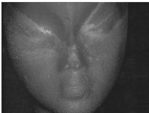
Figura 2. El rostro como pantalla ( Level Five , Chris Marker, 1998)

Es precisamente la imposibilidad de realizar este movimiento de objetivación, de separarse de los discursos del horror, el que lleva a Laura a internalizarlos sin posibilidad de reacentuarlos, hasta el punto de que no puede distinguir su propio dolor dentro de la herida general de la historia.