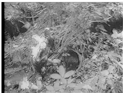
Figura 4. Gustave o el sufrimiento como discurso ( Level Five , Chris Marker, 1998)

Gustave testifica contra la guerra. No es posible debilitar su testimonio solo para incluir unos segundos más de metraje. ¿La verdad? ¿Qué es la verdad? La verdad es que la mayoría no se levanta. ¿Por qué darle a este un tratamiento especial? ¿La ética de la imagen? ¿Es ético el Napalm? ¿Estás a favor del Napalm? ¿En qué lado estás camarada? (Marker, Level Five )