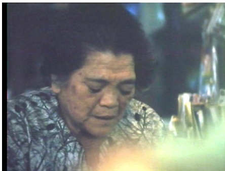
Figura 3. Guardianas de la memoria en el mercado de Naha ( Level Five , Chris Marker, 1998)