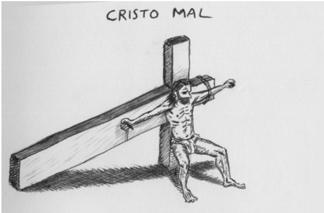
Figura 5. Miguel Noguera. Cristo Mal. 2011.

Podríamos encontrar aquí un paralelismo entre el proyecto de Arturo y algunas de las ideas desarrolladas por Miguel Noguera, a quien se le ha catalogado como uno de los exponentes del post-humor en España.