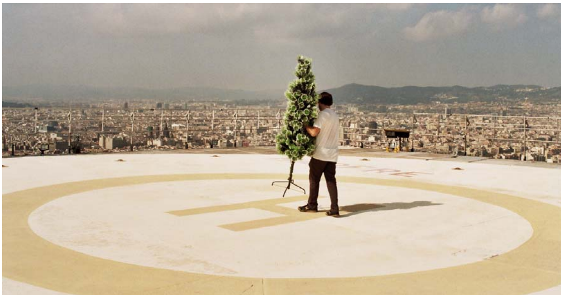
Figura 2. Fermín Jiménez Landa. “Desempatar las dos torres más altas de Barcelona”. 2009.

Este interés por lo desacralizado y lo vulgar pone en cuestión los grandes discursos, las grandes pretensiones. Otra obra en la que podemos ver lo absurdo de la práctica de Fermín es la titulada “Desempatar las dos torres más altas de Barcelona”. Para esta acción el artista se valió de un acontecimiento sucedido en Italia en el siglo XIV, cuando la familia Guinigi colocó un olmo en lo alto de su torre para convertirla en la torre más alta de la ciudad. La altura de la torre era un símbolo de poder que persiste en el imaginario colectivo, hoy en día las grandes torres no las construyen las familias nobles sino las grandes empresas. Fermín desempata la altura de dos rascacielos de Barcelona colocando un arbusto de plástico en la Torre Mapfre, añadiéndole casi dos metros. Un acto burlesco y ridículo que pone de manifiesto no solo el absurdo de su acción, sino también el de las actuales estrategias de control, autoridad y poder.