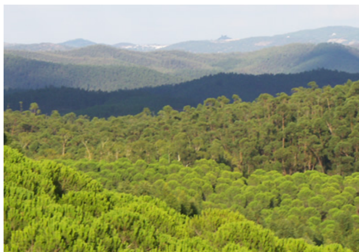
Figura 29. Natural Place of Sierra Pelada y Rivera del Aserrador

Apart from the colony of black vultures the presence of endangered species such as the short-toed snake eagle, booted eagle, Eurasian eagle-owl or black stork is also very important. Among the mammals wild cat, mongoose and wild boar, apart from otter in the main water courses.