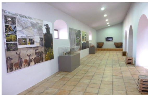
Figura 10. Information Point of the Natural Park

It is also located in the Convent of La Cilla, together with the Rosary Museum, the Archaeological Museum, the Visitors' Reception Centre and the Municipal Historical Archive.