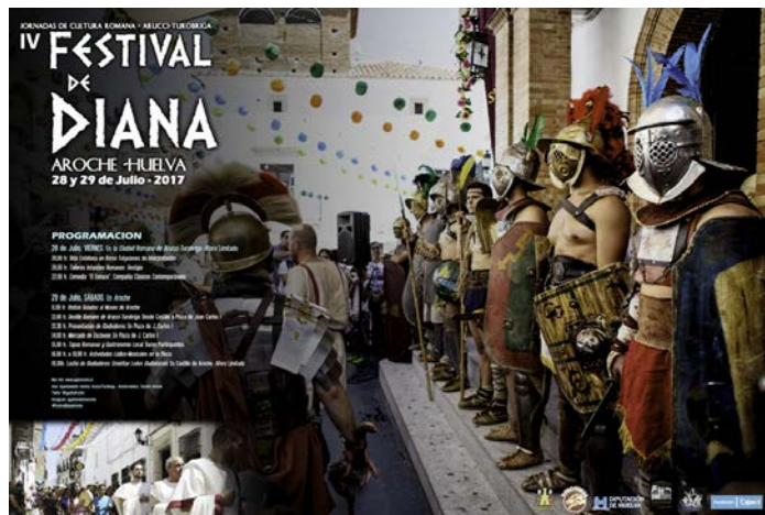
Figura 13. Diana Festival

Diana Festival is an event that in 2017 will celebrate its 4 th edition. It is a fiesta of Roman origin in honour of Goddess Diana, goddess of hunting and nature present in the archaeological site of Arucci/Turobriga, the Roman City of Aroche.