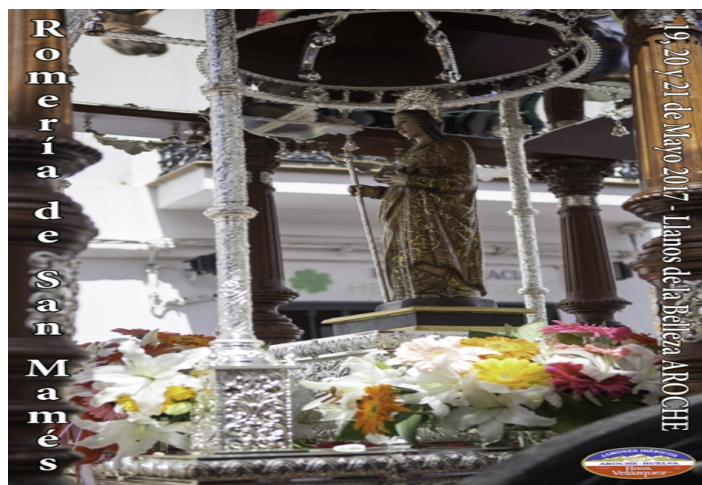
Figura 15. Procession of Saint Mamés