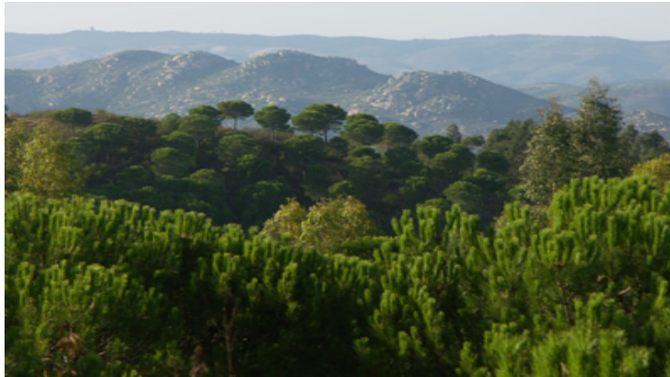
Figura 30. Peñas de Aroche

This area of medium elevations occupies about 700 hectares of the municipal area of Aroche, and it is very rough in its middle part. Geomorphologically highlights the ravines and washouts formed due to the outcrops of acidic rock, mainly granite, which form a batholith.