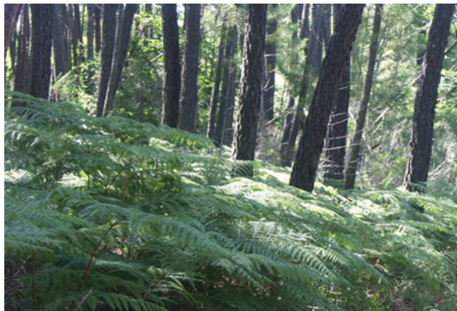
Figura 28. Natural Park of Sierra de Aracena y Picos de Aroche

It is located in the westernmost area of Sierra Morena, in the north of the province of Huelva. The Park occupies a surface of 186.872 hectares distributed among 28 municipalities of the Sierra de Huelva. It is crossed by a fluvial network collected in three hydrographic basins: the one of the Guadalquivir (Riverbank of Huelva), the one of the Guadiana (Caliente, Mútigas, Ingenio) and the one of the Odiel (Riverbank of Linares, Riverbank of Santa Ana).