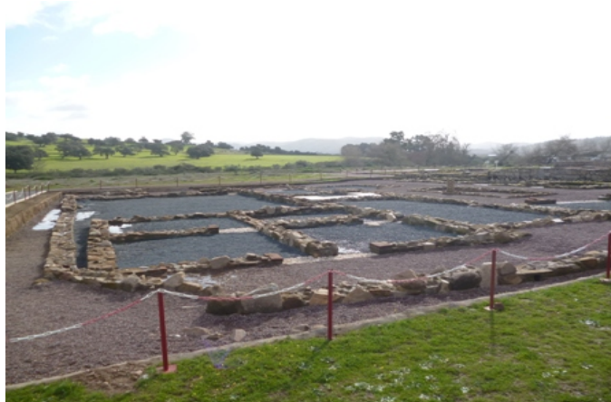
Figura 19. The Roman city of Arucci/Turobriga

The city of Arucci/Turobriga was founded in times of Augustus, at the end of the 1 st century BC. It is the culmination of a process that started halfway through the 2 nd century BC with the conquest of the Celtic Baeturia, in which the territory of the Sierra of Huelva was. Throughout this period the populations of this region showed their unruliness to the power of Rome. At the beginning, they supported the performances of Viriatus and the Lusitanian leaders in their attacks in the Guadalquivir valley, to later, in the 1 st century, take part, in some of the sides, in the Sertorian and Pompeian civil wars.