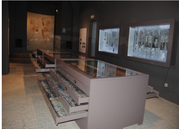
Figura 8. The Rosary Museum