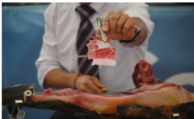
Figura 31. Where to eat