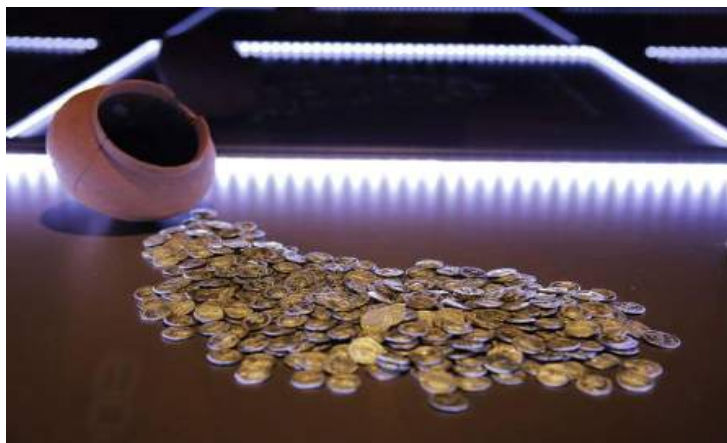
Figura 20. The Market

The Market of Arucci/Turobriga is located north of the Forum, separated from it by a narrow corridor. It is a building with about 11 taverns organized around a porticoed central patio or atrium with six columns. Its front opened along the perimeter into a portico supported with pillars. It is currently under study.