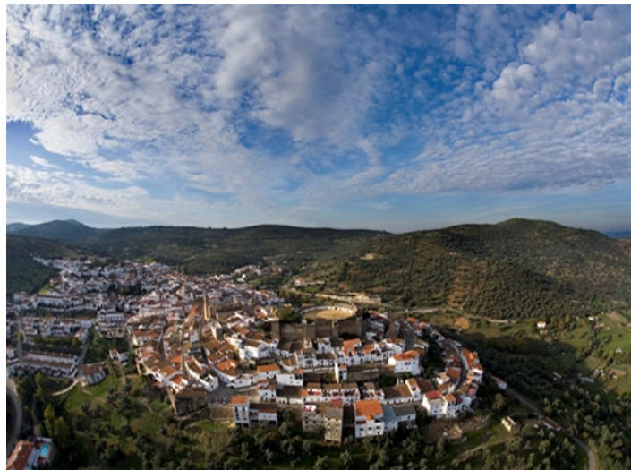
Figura 2. Aroche

Aroche is a typical village of the hills of Huelva. It is located in the foothills of Sierra Morena mountain range. It represents a comforting and attractive place for any visitor. Aroche is one of the villages with the best heritage in the province of Huelva, it is within the Natural Park Sierra de Aracena y Picos de Aroche.