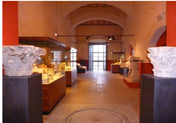
Figura 4. Archaeological Museum

It was created in 1958, and it has experienced important modifications regarding both its collection and its location. It currently occupies three rooms of La Cilla building, an old Hieronymite Convent.