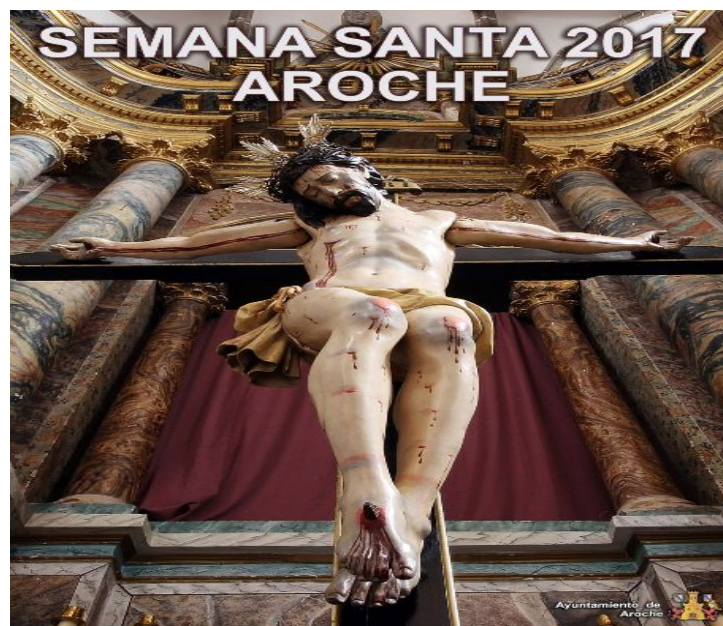
Figura 17. Holly Week

The images of Nuestra Señora de los Dolores (Our Lady of Pain), The Christ of Humildad y Paciencia (Humility and Patience), Jesús of Nazareth, El Cristo Sentado (The Sitting Christ), and the Cristo de los Niños (Children's Christ), go in procession through the narrow streets of the village between the silence and the smell of incense. Just the contemplation of some images makes the place worthy to visit, for this reason the number of visitor is bigger and bigger every year.