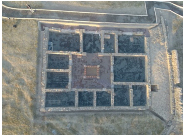
Figura 24. La Casa Norte (The North House)

It is the only house in Aroche/Turobriga whose ground plan we know completely and it has been recently excavated.