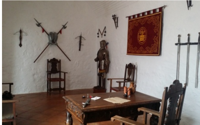
Figura 11. The Castle's Governor's Room