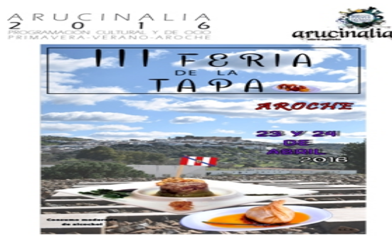
Figura 16. Tapa's Fair

At the end of May, the Tapa's Fair is celebrated, with two days to enjoy the rich and varied cuisine of Aroche and at a great price.