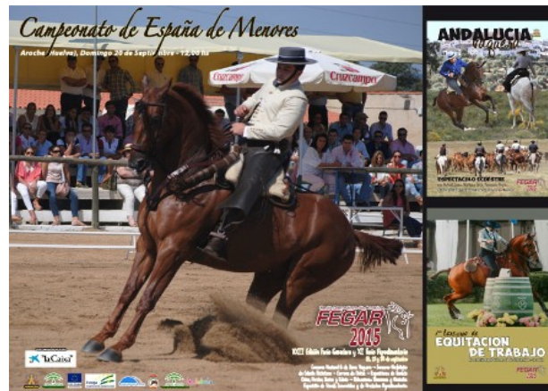
Figura 12. FEGAR

It is the livestock and agri-food Fair that Aroche celebrates around the third week of September in the exhibition site of Llano de la Torre, which has become a referent in the provinces of Huelva and Badajoz for those who are very fond of horses.