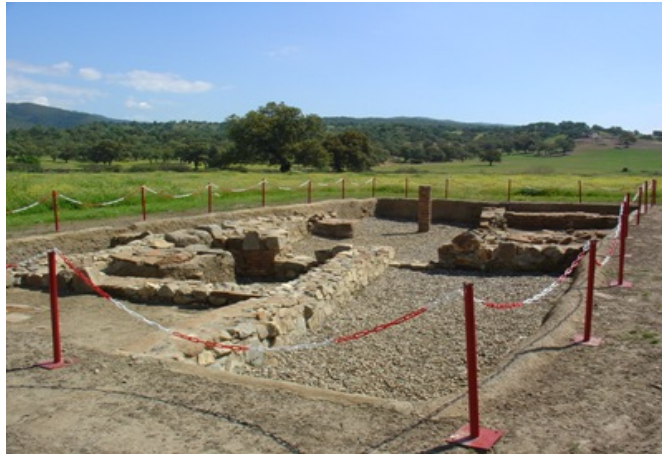
Figura 25. La Casa de la Columna (The House of the Column)

This house is partially excavated, it is possible to identify nine large rooms arranged around an open central area. During the years of occupation of the building (between the middle of the 1 th century and the beginning of the 3 th century) there were different constructional phases identified by the presence of new structures and by the changes in the building techniques.