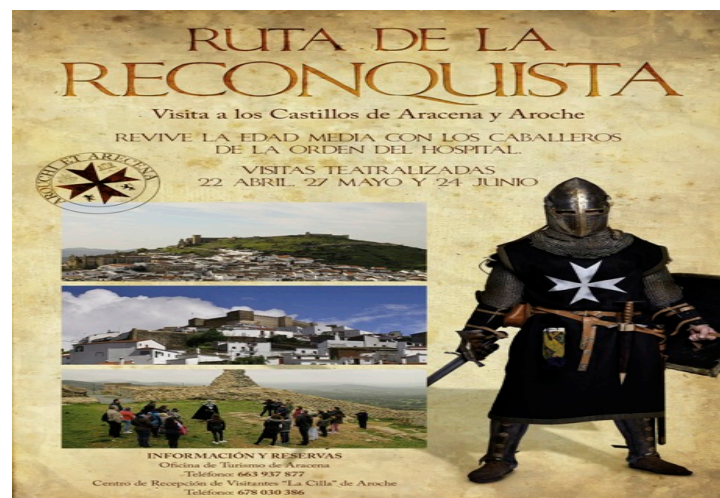
Figura 18. Route of the Reconquest

The Villages of Aracena and Aroche promote together their Castles with the "Route of the Reconquest". It is a dramatized tour guided by the "knights of the Order of The Hospital" that will transport the visitor back in time to the Middle Ages.