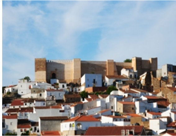
Figura 5. Almohade Castle

The Almohade Castle was built at the end of the 11 th century and the beginning of the 12 th century. It crowns the hill where the city center is located, inside its walls is a bullring built in 1804.