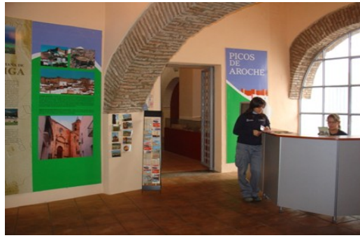
Figura3. Visitors Centre