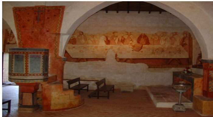
Figura 9. Chapel of Saint Mamés

This chapel is one of the so-called repopulation chapels, built between the end of the 13 th century and the beginning of the 14 th century. It was expanded and improved in the 15 th and 18 th centuries.