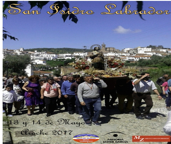
Figura 14. Fiestas de San Isidro

The association of Saint Isidro recovered a couple of years ago these traditional fiestas in honor of Saint Isidro the Ploughman. On the 13 th and the 14 th of May the Association of Saint Isidro organizes the recovered fiestas in Honour of Saint Isidro.