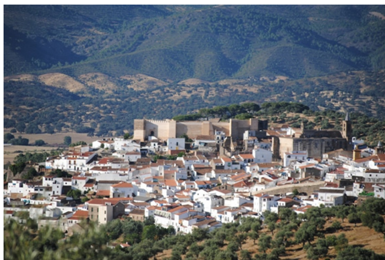
Figura 32. Where to sleep