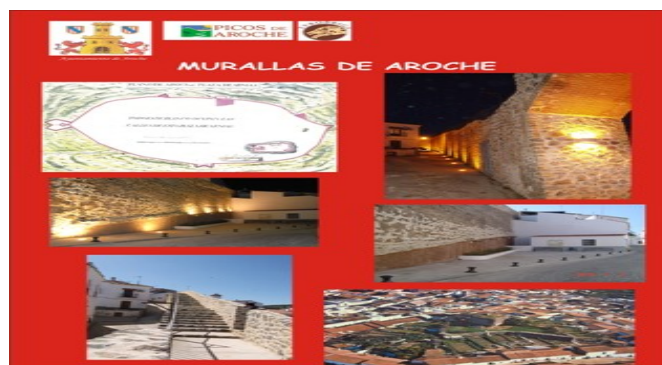
Figura 6. Artillery Wall

The Artillery Wall maintains a plan of 1735 which allows to see the complete layout of this wall, with four bastions, a big tower and the Tower of Saint Ginés, currently surrounded by buildings.