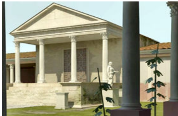
Figura 27. Virtual Reconstruction

Inside the Chapel of Saint Mamés, the city council of Aroche keeps open a permanent exhibition about the forum of the city of Turobriga. Made by the archaeology Department of the University of Huelva it explains the history of this archaeological site. As well as the investigations made to interpret this Roman setting of the 1 th century, it recreates with images a virtual reconstruction of the public square or forum.