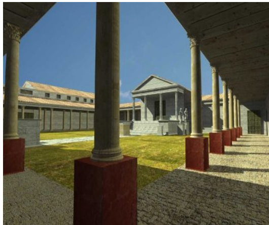
Figura 22. The Forum

It is an enclosed area of about 50 x 40 meters. We find in it the characteristic buildings that helped the development of the main functions of the forum: the religious and the civil ones.