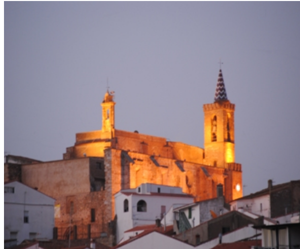
Figura 7. Church of Nuestra Señora de la Asunción

It is a building of big dimensions, with three naves and four sections, the last one is unfinished. The current church was started in 1483, built over a previous building of the 14 th century.