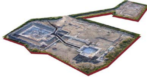
Figura 23. The Thermal Baths

We ignore the total length of these public baths. The excavated area probably does not even reach one third of them. Currently the natatio of 9.70x6.42 meters is the only part of the bath able to be visited together with the part of the associated infrastructures.