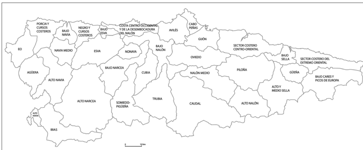
FIG. 2. Unidades de paisaje en Asturias.