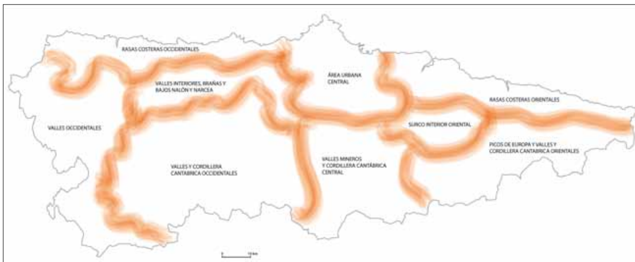
FIG. 3. Demarcaciones paisajísticas en Asturias.

socioeconómica regresiva o, incluso, en un punto de no retorno y colapso en las actividades y ocupación residencial. Además, no debe confundirse esta denominación con una especie de categoría que señale los mejores paisajes de cualquier territorio; no se trata de establecer un rango superior, sino de llamar la atención sobre aquellos que, dado su carácter excepcional, precisan de una atención también especial que salvaguarde sus valores. En otras palabras, la consideración de LEVP no es sólo un reconocimiento de valores, sino sobre todo la consideración de que su protección y gestión han de ser especiales y servir de ejemplo para la gestión de otros paisajes de interés cultural.