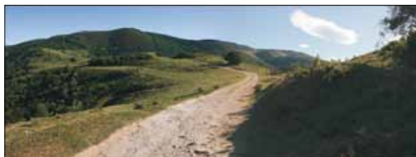
FIG. 7. El Camín de la Mesa en el puerto de San Lorenzo (Somiedo/Tevera). Fuente: Autor.

entendida como exhaustiva y cerrada, sino que proyecta el resultado de una mirada patrimonial distinta a las efectuadas hasta ahora al territorio asturiano. En este sentido, podría afirmarse que no están todos los que son, pero sí son todos los que están.