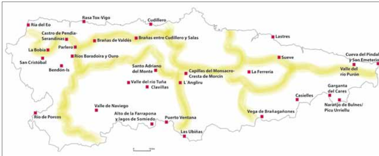
FIG. 8. Los lugares de excepcional valor paisajístico (LEVPAS) en Asturias.

PICA en el área central de la región, interrumpiendo su definición entre las proximidades de Pola de Siero y el río Nalón. No es que no se reconozca el Camino como bien cultural, entre otros concejos, a su paso por el de Castrillón o el de Oviedo, sino que se considera que su potencialidad para proyectarse en un paisaje de interés cultural ha sido alterada en estos tramos.