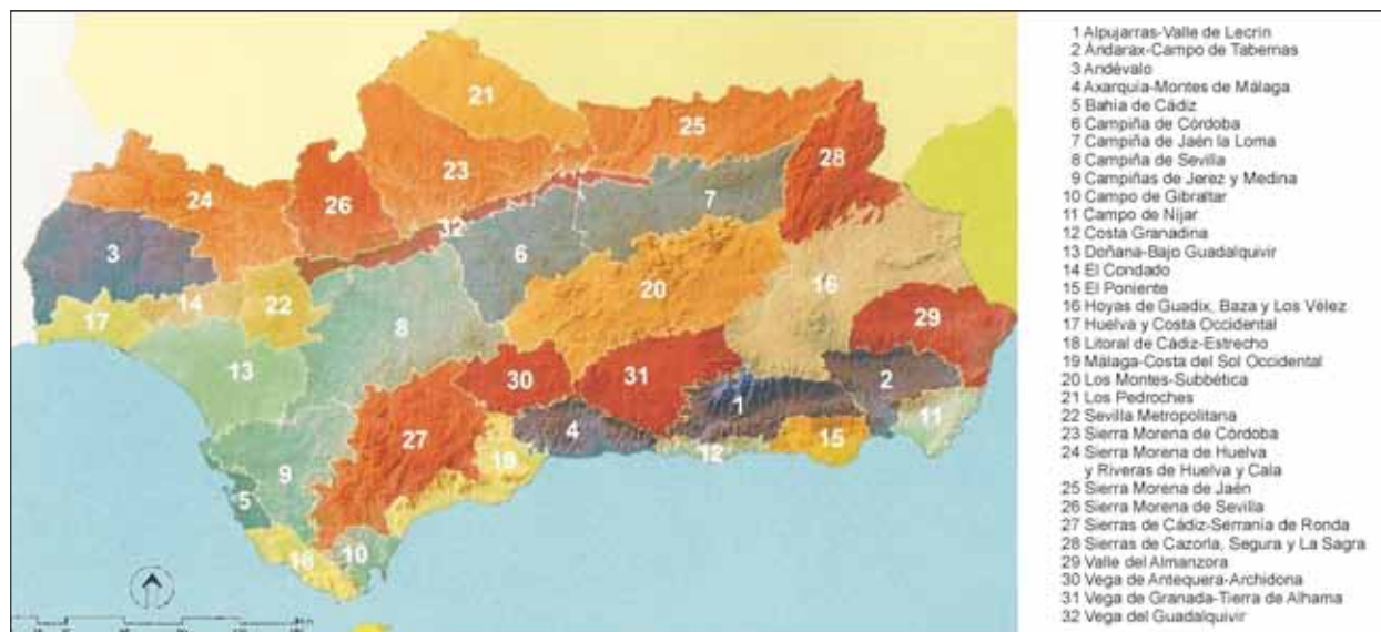
FIG. 1. Definición de demarcaciones paisajísticas en Andalucía.

y otros, 2012). No obstante, aún se trata de un campo de trabajo poco desarrollado; especialmente en lo relacionado con los paisajes de interés cultural. No resulta fácil señalar cuáles son los valores patrimoniales del paisaje desde el punto de vista cultural, campo cuyas metodologías de análisis son extraordinariamente complejas, pero sí al menos puede convenirse en que tales valores se convierten en identitarios para las poblaciones que los habitan y que son susceptibles de obtener reconocimientos oficiales para su protección y mejor gestión. Para ello se propone establecer dos escalas de referencia: