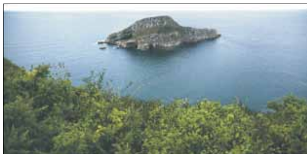
FIG. 5. Isla de la Deva (Castrillón).

Tal y como se ha descrito en la primera parte de este artículo, su objetivo era identificar los paisajes de interés cultural de Asturias (PICAS, véase Fig. 4). Los PICAS han sido seleccionados en razón de los criterios señalados en los epígrafes del punto 3, tanto en lo que responde a la selección de su dominante patrimonial, como en lo que respecta a otros aspectos; entre ellos por su carácter excepcional y único (véase Fig. 5), o bien porque son ejemplos destacados de un tipo de paisaje cultural más extenso en la región (por ejemplo, algunas brañas u otros paisajes agrarios, véase Fig. 6). Hay que recordar que el objetivo básico en la identificación de PICAS que se ofrece en este trabajo es una primera propuesta que no debe ser