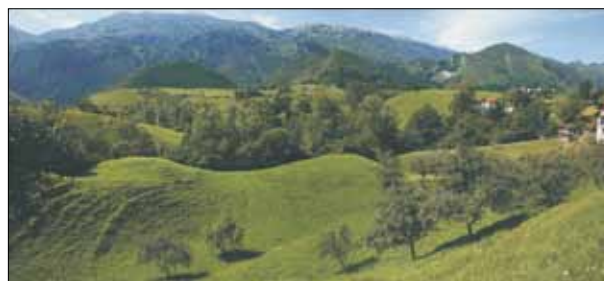
FIG. 6. Ejemplo destacado de paisaje agroganadero en Purón (Llanes).