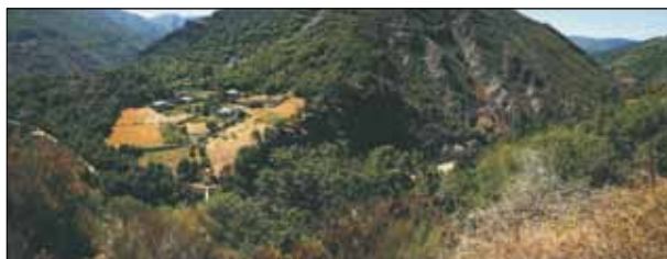
FIG. 9. Río de Porcos (Ibias).

En cuanto a las categorías de los LEVPAS como paisajes de interés cultural, destacan los relacionados con los sistemas de producción agrarios, especialmente en brañas o valles de la cordillera; y les siguen los LEVPAS relacionados con referentes naturales connotados, especialmente montañas y puertos (cuadro 4).