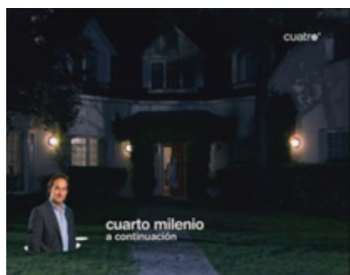
Figura 3. Fotograma Cuatro. Captura de pantalla de un episodio de "Hay alguien ahí".

En cuanto a las sobreimpresiones utilizadas durante la emisión de las series de televisión, éstas pueden situarse tanto en la parte superior, como inferior de la pantalla. No obstante, la posición del crawl determina un uso distinto en cada caso: las sobreimpresiones superiores tienen relación directa con el contenido emitido en ese momento (nombre del programa o capítulo en caso de una serie, aviso de la posibilidad de interacción con la web...) y las sobreimpresiones que aparecen en la posición inferior de la pantalla promocionan otros contenidos: pueden dar información sobre la fecha y hora de emisión de otro programa, avisos de última hora, frases promocionales, etc. Los textos de las sobreimpresiones son escritos con la tipografía y colores corporativos de Cuatro.