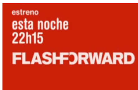
Figura 7. Fotograma de promo de Cuatro.

En cuanto al corporativismo de las cadenas, el caso de los logotipos nos da una pista de lo que nos encontraremos. Los logotipos de ABC y Cuatro aparecen en todas las promociones respectivamente y, como hemos visto, también las voces en off se corresponden con las voces corporativas de las cadenas. Sin embargo hay un canal que sobresale en cuanto a la mayor dotación de corporativismo a las piezas promocionales, nos referimos a Cuatro que, gracias al fácil reconocimiento de los colores rojo y blanco posibilita la identificación con el canal y establece una mayor relación entre el producto y la cadena ante los ojos del espectador. Además de los colores, Cuatro hace uso en los anuncios de "Flashforward" de su tipografía corporativa. Esto se puede apreciar tanto en los intertítulos como en los rótulos de texto que indican el horario y día de emisión de la serie.