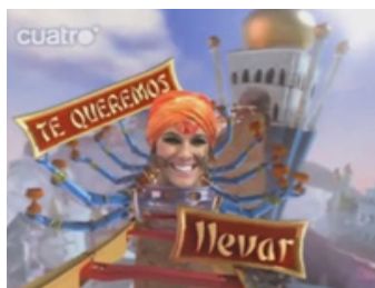
Figura. 1. Fotograma de cortinilla de Cuatro.

Las cortinillas de Cuatro han sido toda una novedad desde su nacimiento. Cuando lo común era hacer solamente una animación del logotipo, esta cadena introduce a los rostros famosos que la caracterizan, en la pieza. Así, presentadores o actores protagonizan este corto espacio que separa la programación del bloque publicitario.