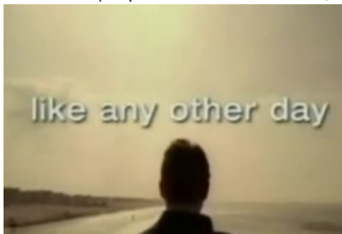
Figura 7. Fotograma de promo de Cuatro.

minúscula. Predominan el uso del contratipo y el relleno blanco de las letras de los textos (corporativismo de la serie, no del canal).