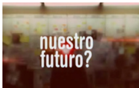
Figura 8. Fotograma de promo de Cuatro.

En el caso norteamericano la preocupación por el corporativismo de la cadena es menos notable. Los colores que predominan en estas promociones son los propios de la I.C. de la serie, blanco y negro. Podemos apreciarlos en las imágenes que aparecen a continuación, en las que además, apreciamos el uso de una tipografía como la del logotipo de la serie en sus versiones mayúscula y