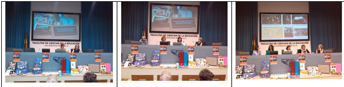
Imágenes 14-16: Instantáneas pertenecientes a la presentación en público de juegos didácticos histórico educativos diseñados por el alumnado de Historia de la Educación Contemporánea. Grado en Pedagogía. Curso escolar: 2013-14.