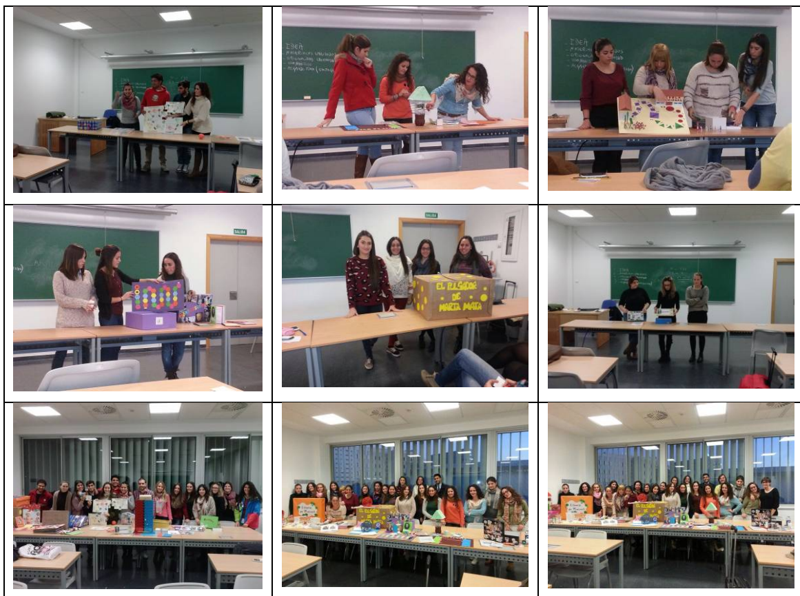
Imágenes 5-13: Instantáneas pertenecientes a juegos didácticos histórico educativos diseñados por el alumnado de Historia de la Educación Contemporánea. Grado en Pedagogía. Curso escolar: 2013-14.

Con esta experiencia, ponemos de manifiesto que aprender de otra manera más constructiva y creativa en la Universidad es posible. Los estudiantes se enriquecen conociendo el pasado histórico educativo de una manera más dinámica, colaborativa y participativa y, a la hora de seleccionar y asimilar conocimientos relacionados con diferentes personajes de la Historia de la Educación, se multiplican las posibilidades de aprendizaje, tanto en cuanto el estudiante consigue transferir lo aprendido al diseño de un juego didáctico especialmente dedicado al personaje de estudio en cuestión. Gracias a experiencias de este tipo, podemos reconocer que existen nuevas formas de aprender y transferir el conocimiento aprendido a situaciones y contextos en los que nos desarrollamos día a día en nuestra cotidianidad. La siguiente galería fotográfica recoge a continuación una muestra del resultado de los trabajos realizados, en la que aparecen los estudiantes universitarios orgullosos exponiendo y mostrando con convencimiento y alegría los juegos didácticos creados.