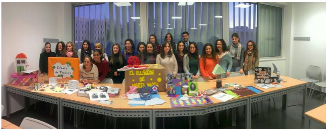
Imagen 17: Instantánea perteneciente a juegos didácticos histórico educativos diseñados por el alumnado de Historia de la Educación Contemporánea. Grado en Pedagogía. Curso escolar: 2013-14.