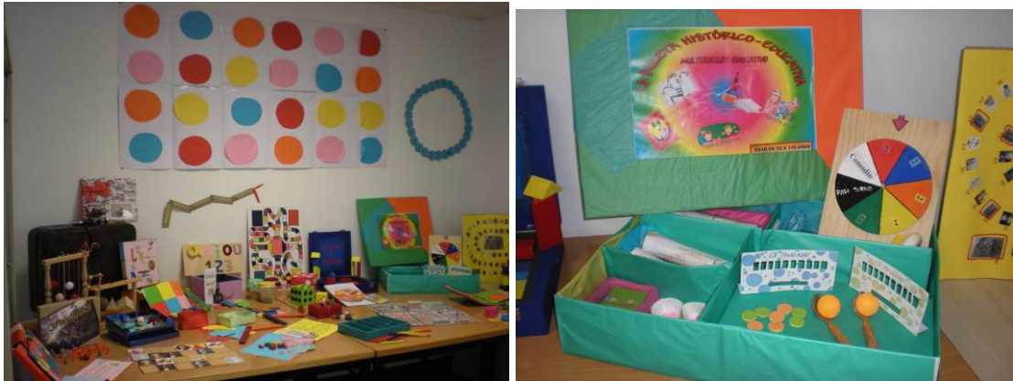
Imágenes 3 y 4: Instantáneas pertenecientes a juegos didácticos histórico educativos diseñados por el alumnado de Historia de la Educación Contemporánea. Grado en Pedagogía. Curso escolar: 2013-14.