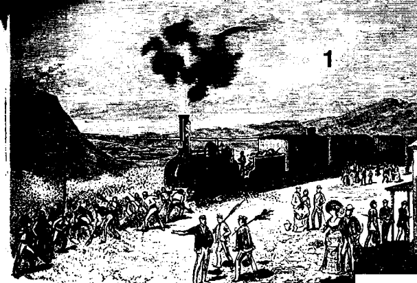
ESPAÑA.—TREN DETENIDO POR UNA NUBE DE LANGOSTAS EN LAS CERCANÍAS DE ALMADENES