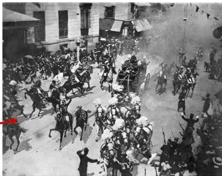
Figura 6. ABC, nº505, 1 de junio de 1906.