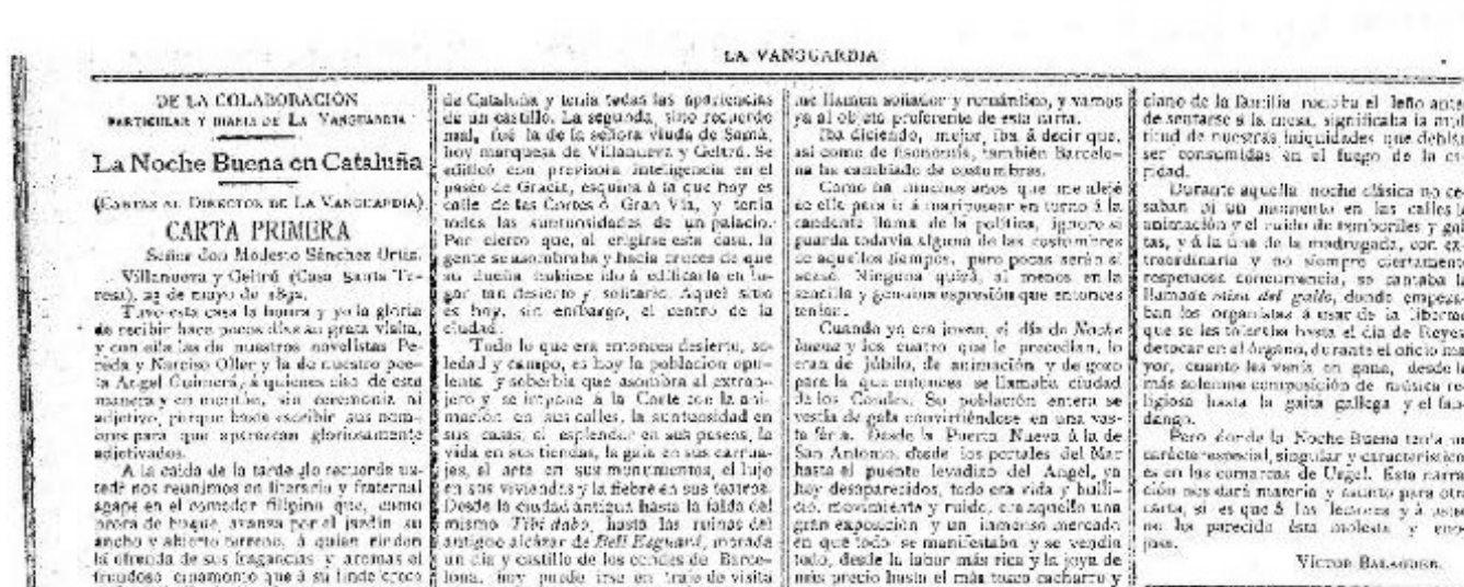
Figura 2. La Vanguardia , 1892.

Tras la publicación de esta carta La Vanguardia añadía: “Agradecemos la noticia, toda vez que nos da ocasión para ponerlo en conocimiento del público, á fin de que no se deje sorprender en caso análogo.”