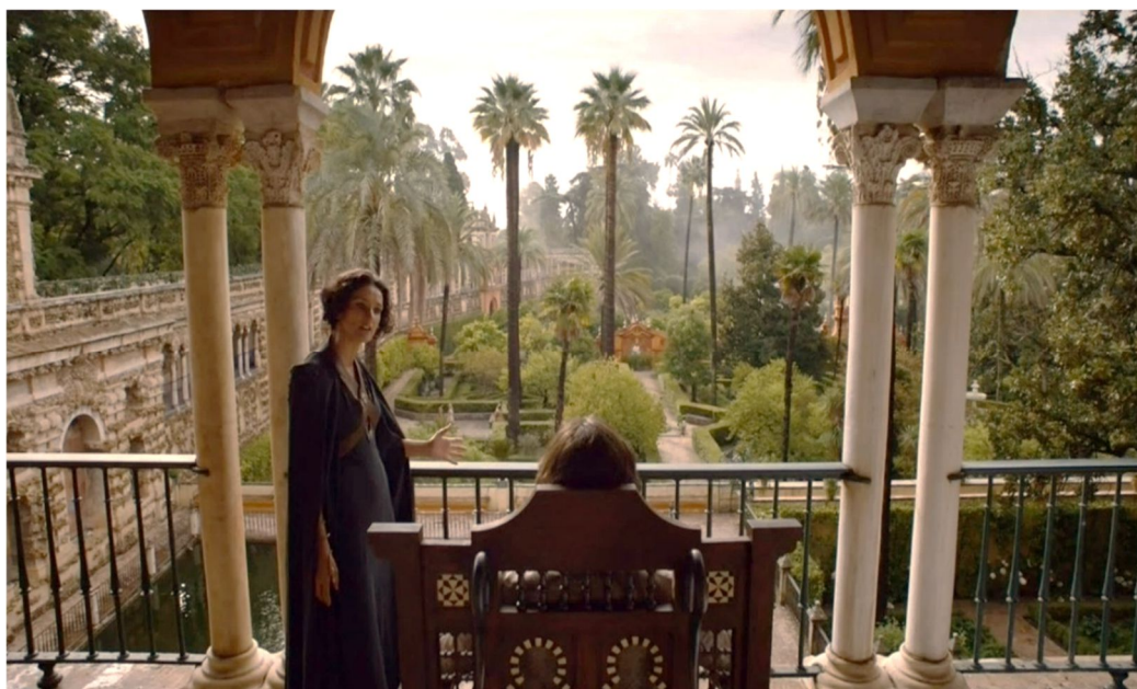
Figura 3.2. Alcázar de Sevilla (Jardines del Agua, Dorne)

La primera aparición del monumento en la serie es en el capítulo dos de la quinta temporada: La casa de negro y blanco (Figura 3.2). El príncipe Oberynt Martell muere a causa de un juicio por combate contra la Casa Lannister y su mujer Ellaria Arena, junto a sus hijas, las temidas Serpientes de Arena, reclaman su venganza al príncipe gobernante Doran Martell (hermano del fallecido).