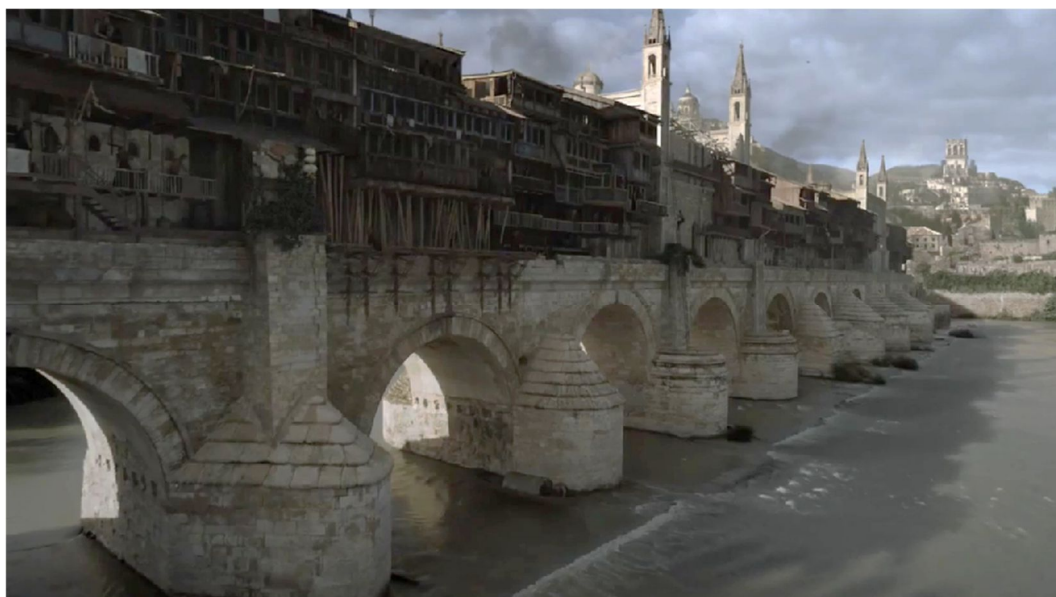
Figura 3.7. Puente romano de Córdoba (Puente Largo de Volantis)

El puente de la Figura 3.7 reaparece en el capítulo siete de la sexta temporada, El hombre destrozado , cuando Yara y Theon Greyjoy hacen una parada en la ciudad en su camino hacia Meereen para aliarse con la madre de dragones. El puente fue grabado sin actores mediante un dron y fue reconstruido mediante efectos especiales.