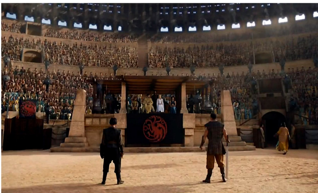
Figura 3.4. Plaza de Toros de Osuna (Fosa de Daznak, Meereen)

Para estas escenas se contó con la colaboración de más de 500 extras provenientes del pueblo y otros municipios cercanos. La grabación duró dos semanas de dedicación, en la serie 17 minutos, siendo una de las batallas más épicas de la temporada (Figura 3.4). La alcaldesa de Osuna quiso dejar constancia del suceso y se colocó una placa en conmemoración a los extras y actores, con cada uno de los nombres de las personas que trabajaron en ella.