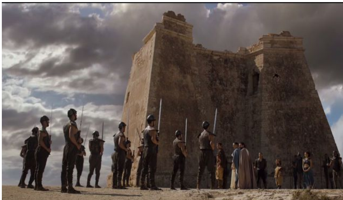
Figura 3.8. Torre de Mesa Roldán, Carboneras (Cumbre de Meereen)