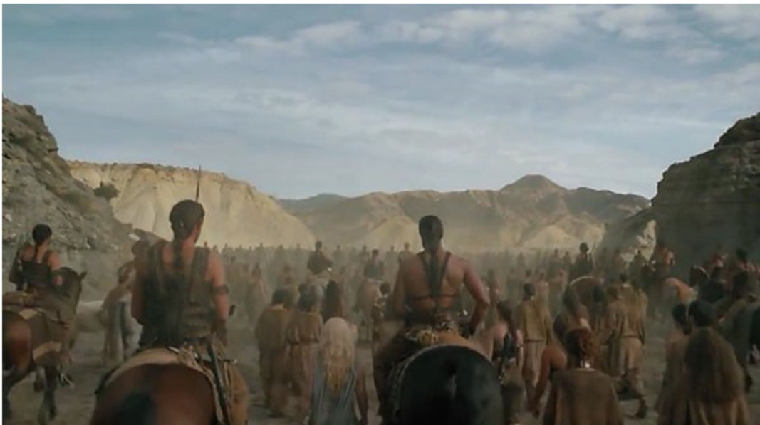
Figura 3.10. Desierto de Tabernas (Mar Dothraki)

Al igual que en el Chorrillo de Pechina, Tabernas es de relieve árido y clima desértico por lo que aprovecharon para rodar algunas escenas del Mar dothraki que, aunque tenga ese nombre, no es un mar, sino un sistema de arenosas montañas con un clima muy seco y caluroso en el que se desarrolla la trama de estas tribus de guerreros nómadas. En el primer capítulo de la sexta temporada La mujer roja , podemos ver de fondo las llanuras del desierto de Tabernas, mientras Daenerys y el khalasar que la tiene presa, caminan hasta Vaes Dothrak donde será juzgada (Figura 3.10).