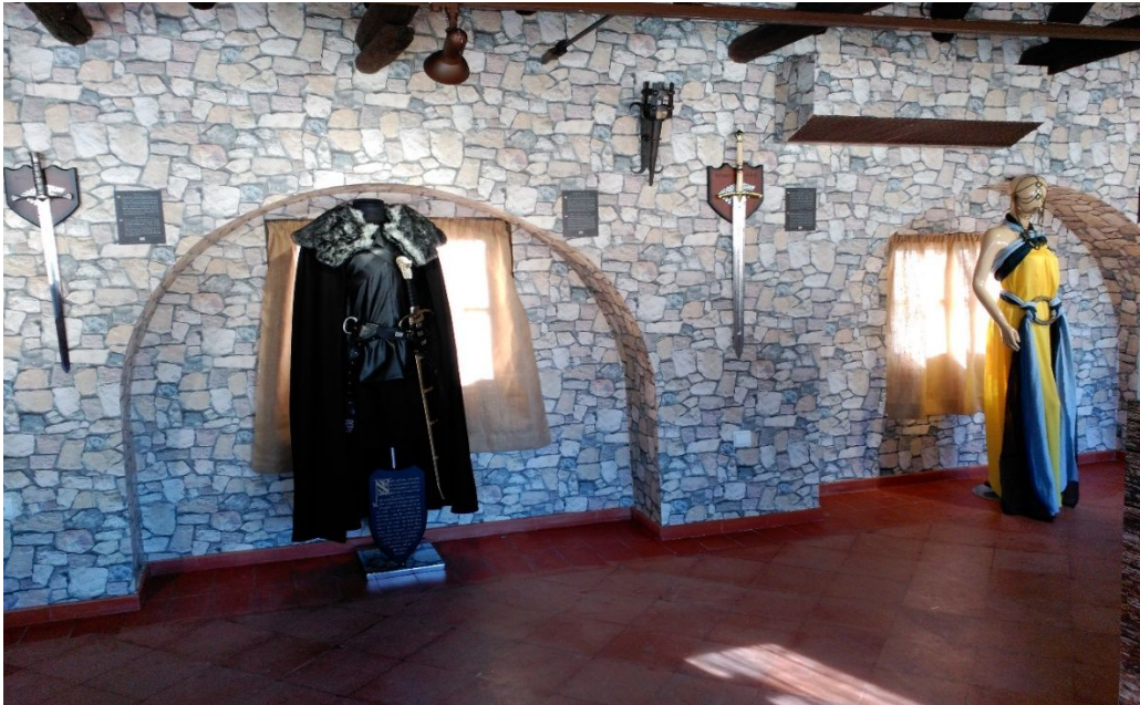
Figura 3.5. Museo de Osuna (Salón de Hielo y Fuego)