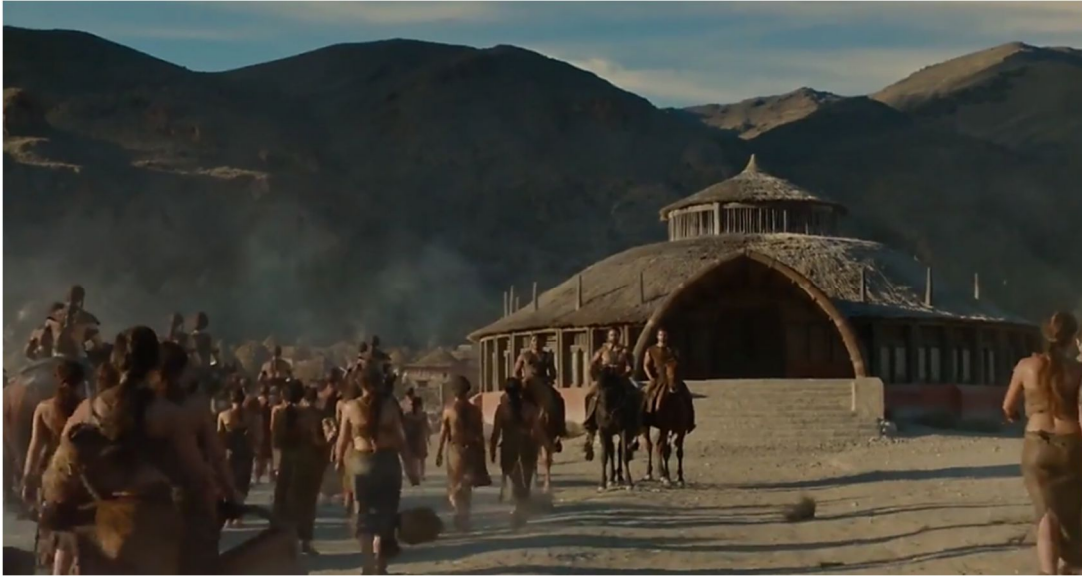
Figura 3.9. El Chorrillo de Pechina (Vaes Dothrak)