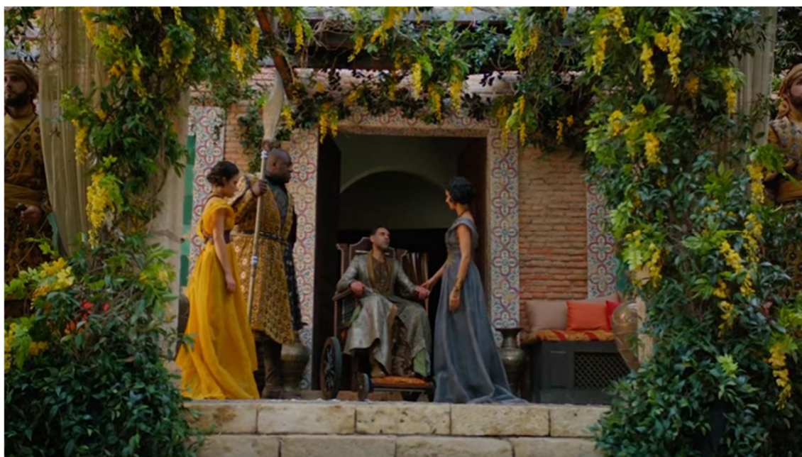
Figura 3.11. La Alcazaba (Lanza del Sol, Dorne)

Para situarnos en la serie, la Alcazaba aparece en el primer capítulo de la sexta temporada La mujer roja , donde Ellaria Arena asesina al príncipe gobernante Doran Martell ya que dice ser un hombre débil por no vengar la muerte de su hermano (Figura 3.11).