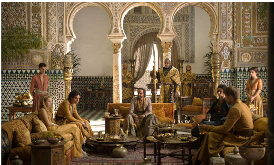
Figura 3.3. Alcázar de Sevilla (Casa Martell, Dorne)

Por último, el capítulo nueve, Danza de dragones , vuelve a filmarse en el interior. En él se reconoce uno de los escenarios más característicos del conjunto monumental: el techo de bóveda dorada junto a las columnas y arcos del palacio mudéjar. Bajo éstos transcurre la escena en la que Jamie Lannister negocia tratos con el príncipe Doran para llevar de regreso a Myrcella con su madre (Figura 3.3).