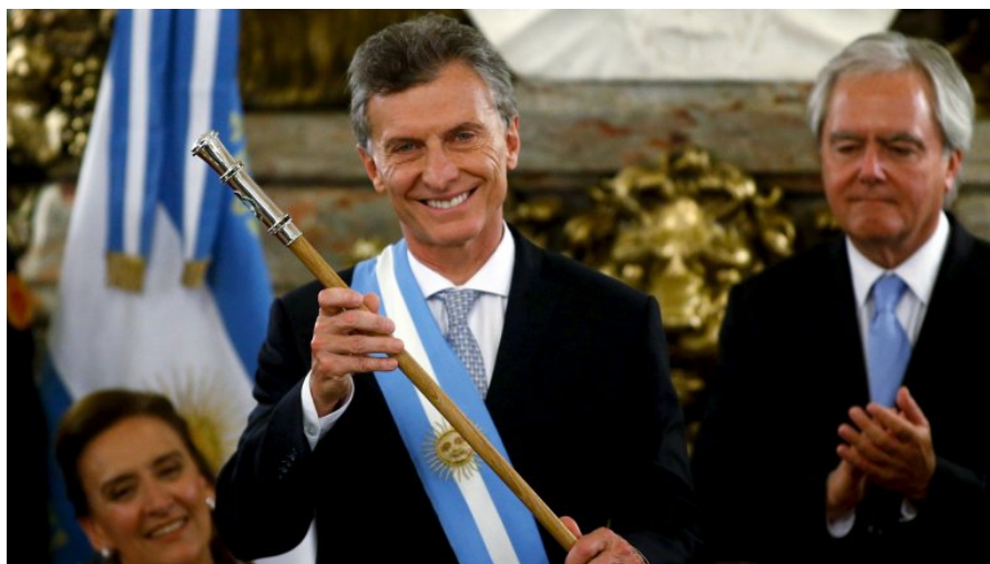
10/12/15

Al finalizar su juramento, a Macri se le notan los ojos llenos de emoción. Además, se toca con su mano el corazón, haciendo un gesto de agradecimiento. Su rostro con sonrisa transmite alegría y habla claro y despacio. Un error de Macri es que observa mucho el papel que tiene en su mesa, leyendo o ayudándose de él, dando vuelta a las páginas, algo que Fernández de Kirchner no hace. Debido a su gran poder de oratoria, ella no lee sus discursos sino que siempre habla sin leer.