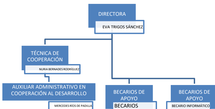
Figura 2.2.1. Oficina de Cooperación al Desarrollo de la Universidad de Sevilla – Fuente: Elaboración propia