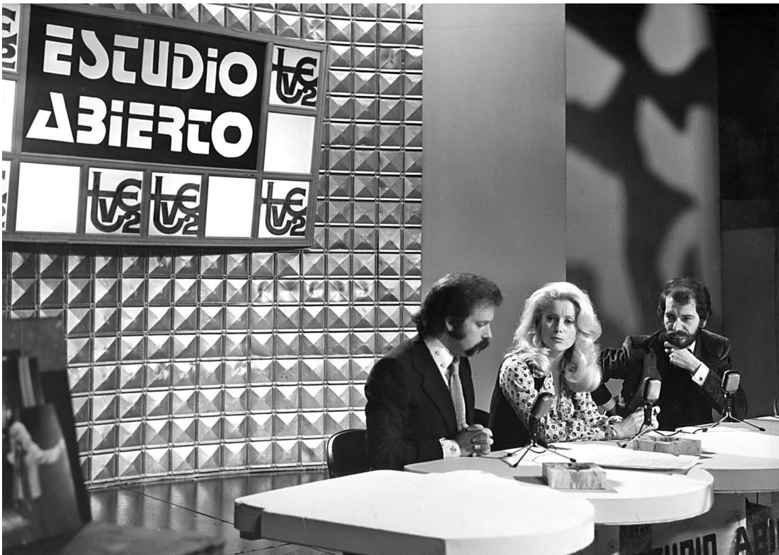
José María Íñigo durante un “Estudio Abierto”.