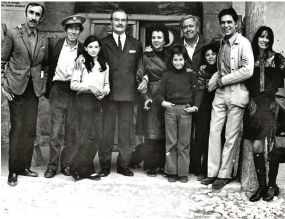
La serie de Antonio Mercero “Crónicas de un pueblo” tuvo mucho éxito.