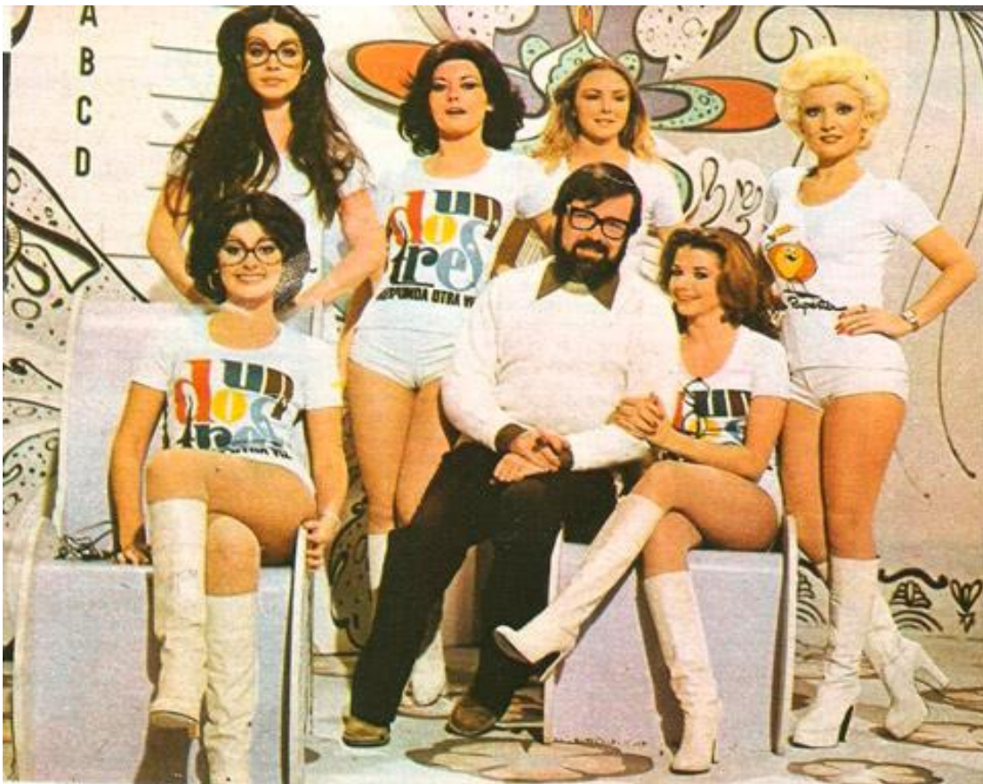
El popular concurso de Narciso Ibáñez Serrador, “Un, dos, tres...responde otra vez” causó furor.