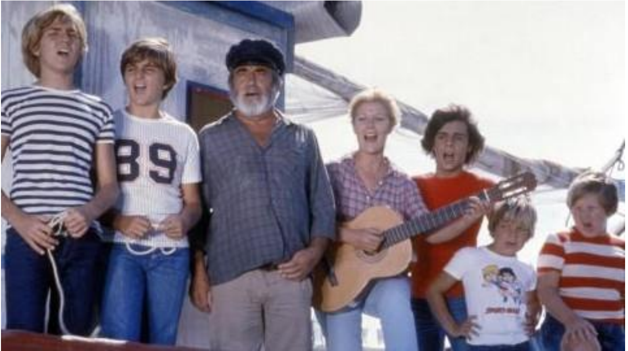
Verano Azul, un clásico de nuestra televisión dirigido por Antonio Mercero.