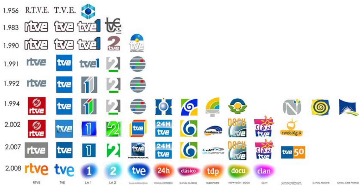
Panel donde se recogen todos los logos de los medios de RTVE.