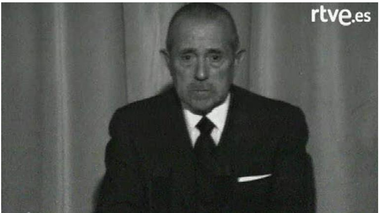
Discurso de Arias Navarro anunciando la muerte de Franco en televisión.