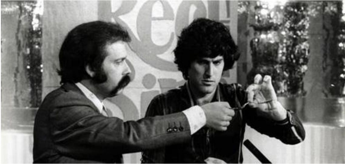
Uri Geller junto a José María Íñigo en “Estudio Abierto”.