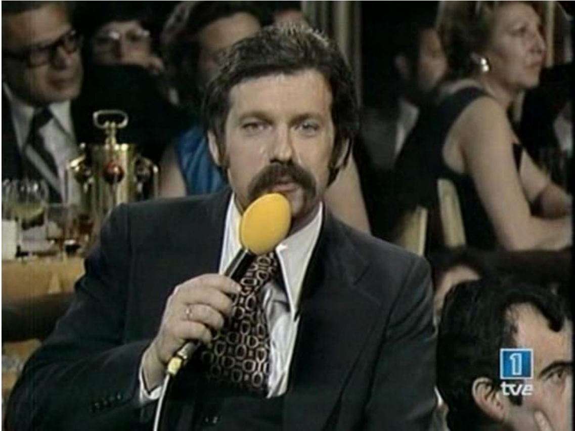
José María Íñigo presentando “Esta noche fiesta”.