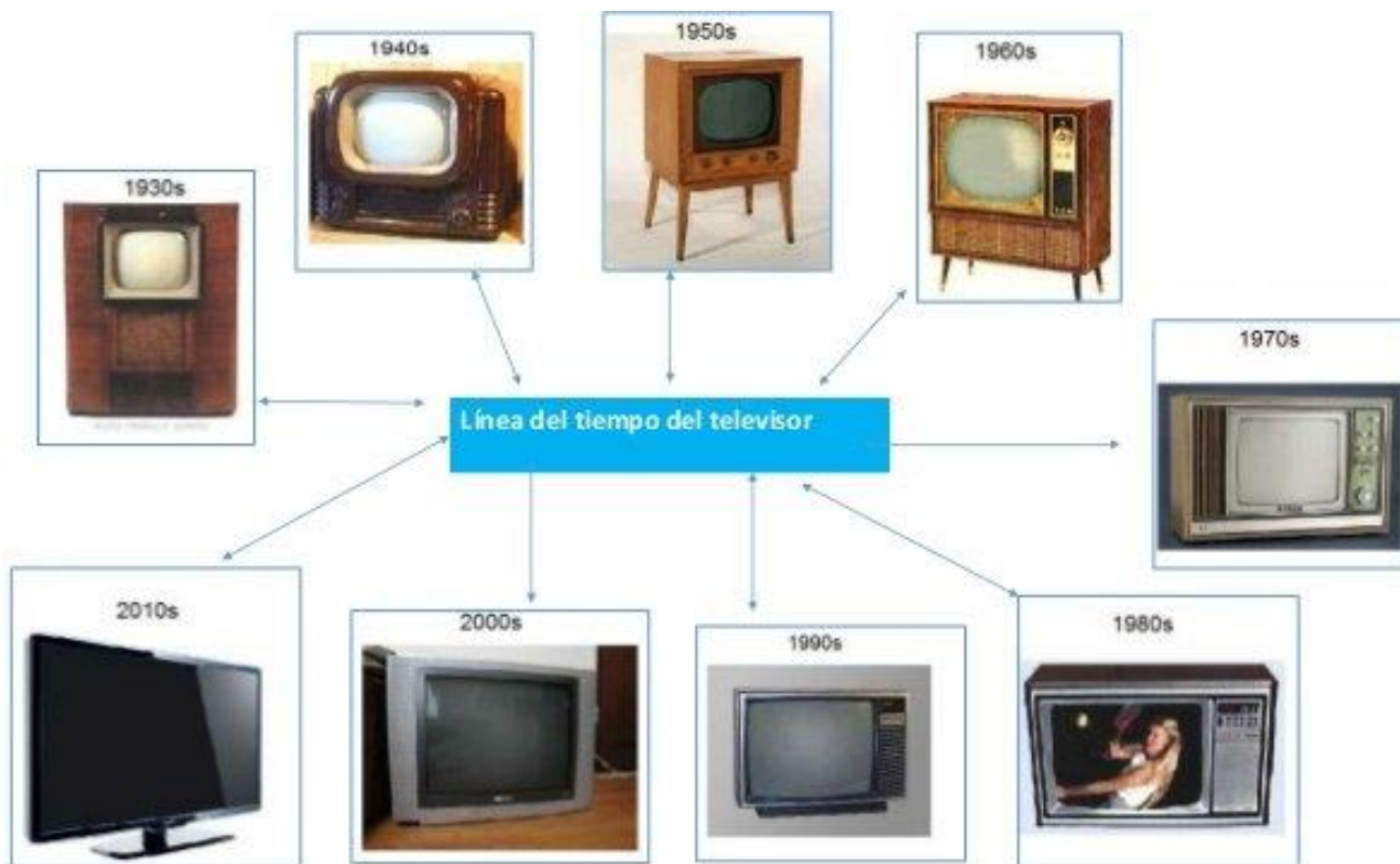
Gráfico evolutivo de la televisión a través del tiempo.