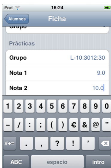
Figura 8. Modificación de una calificación.

Como puede observarse en la figura 9, la aplicación está actualmente desarrollada para satisfacer las necesidades móviles desde el perfil del profesor. El acceso a la información por parte del alumnado únicamente será realizado a través de la aplicación web.