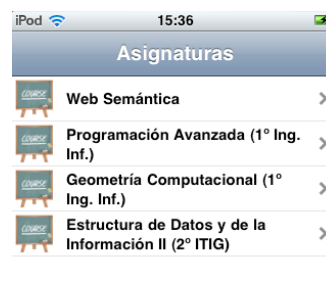
Figura 5. Listado de asignaturas