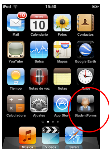
Figura 3. Aplicación de gestión de alumnos.

Para dar una mejor solución a este proceso de evaluación in situ, hemos desarrollado una aplicación iOS denominada StudentForms que permite acceder a la base de datos de la aplicación de gestión de alumnos sin utilizar directamente la interfaz web (ver Figura 3). Cabe decir que el navegador Safari permite el acceso directo a la aplicación web, pero una aplicación a medida permite organizar, acceder y editar la información de una manera mucho más adecuada. Esta aplicación solo incluye parte de la funcionalidad de la aplicación web, concretamente la necesaria para la evaluación de los alumnos durante las sesiones prácticas. A continuación describimos detalladamente esta funcionalidad: