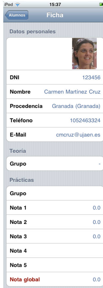
Figura 7. Ficha de un alumno.

Todos los cambios realizados en las fichas son actualizados en tiempo real en la aplicación web, con lo que los alumnos pueden ver inmediatamente la valoración del trabajo realizado en prácticas.