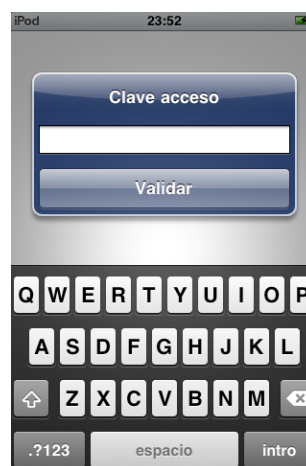
Figura 4. Página de acceso a la aplicación.